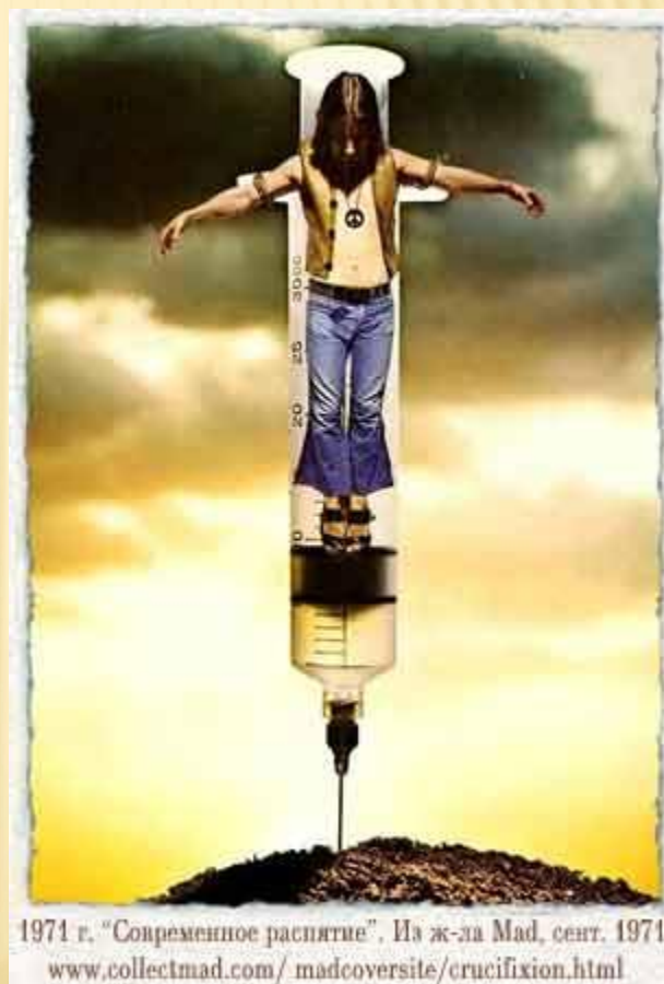
1971 г. "Современное распятие". Из ж-ла Mad, сент. 1971. www.collectmad.com/madcoversite/crucifixion.html