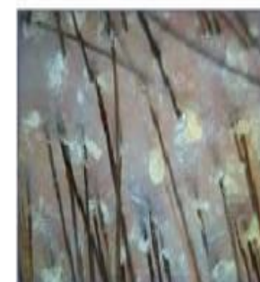
Жирная себорея + перхоть