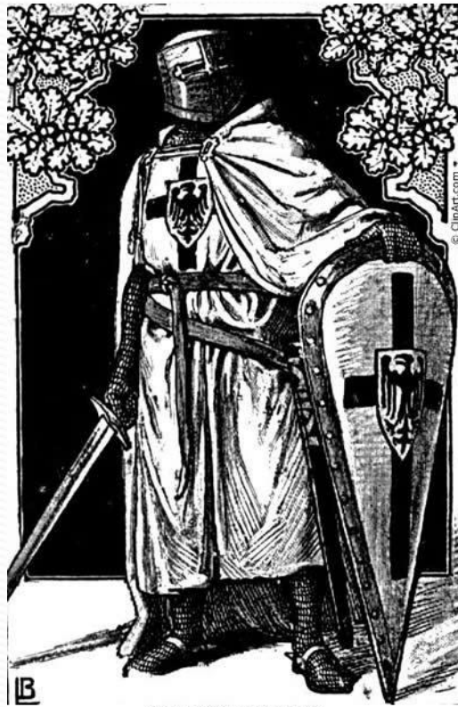
German Crusader Knight