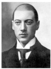
Николай Степанович Гумилёв (1886 – 1921)