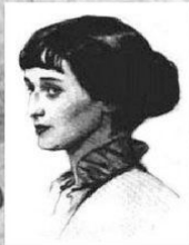
Анна Андреевна Ахматова (1889 – 1966)