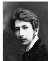
Сергей Митрофанович Городецкий (1884 – 1967)

Туманности и намекам символизма было противопоставлено достоверность образа, четкость композиции . В чем-то поэзия акмеизма — возрождение «золотого века», времени Пушкина и Баратынского. Затуманенное стекло поэзии было тщательно протерто акмеистами и заиграло яркими красками реального мира.