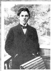
Осип Эмильевич Мандельштам (1891 – 1938)