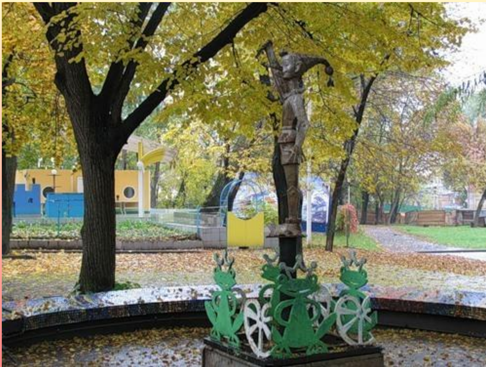
Ростов. Памятник Буратино.