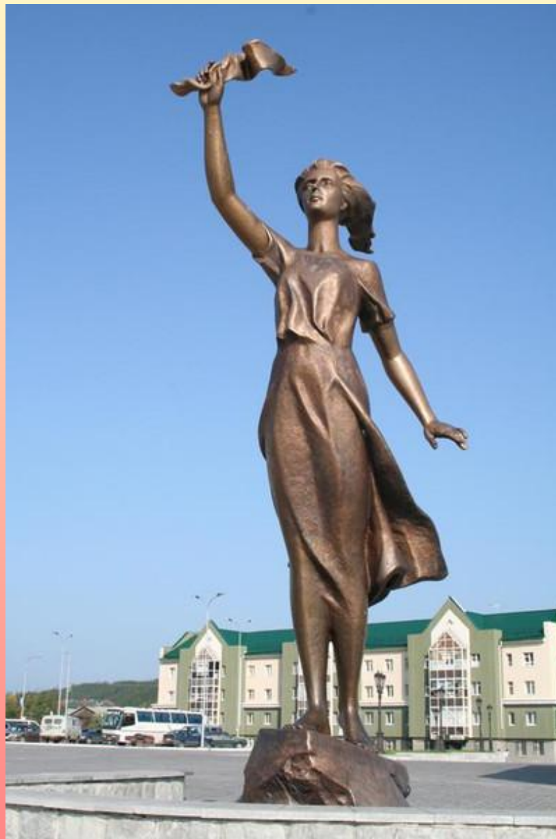
Ханты-Мансийск. Памятник Ассоль.