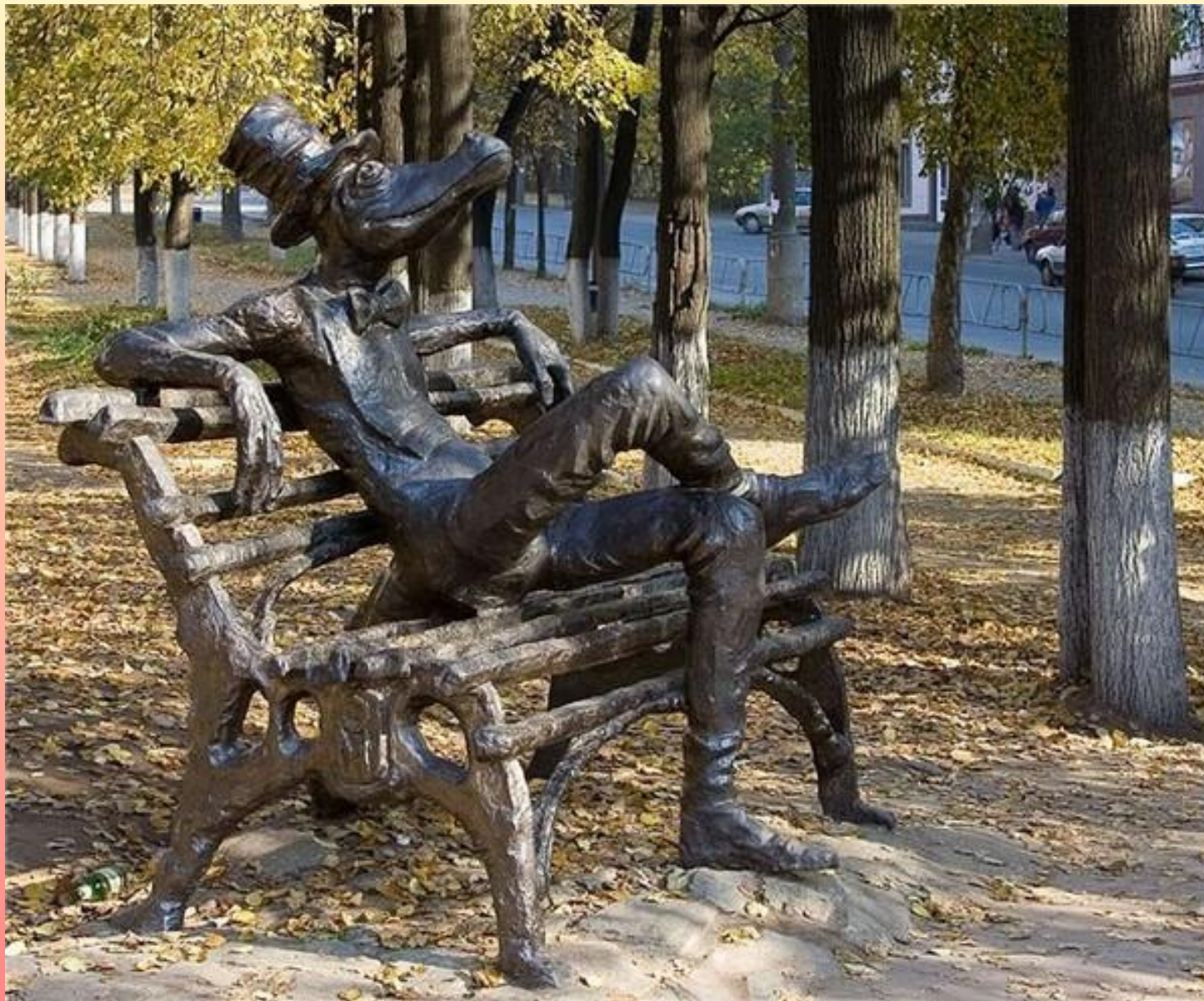
Ижевск. Памятник Крокодилу Гене.