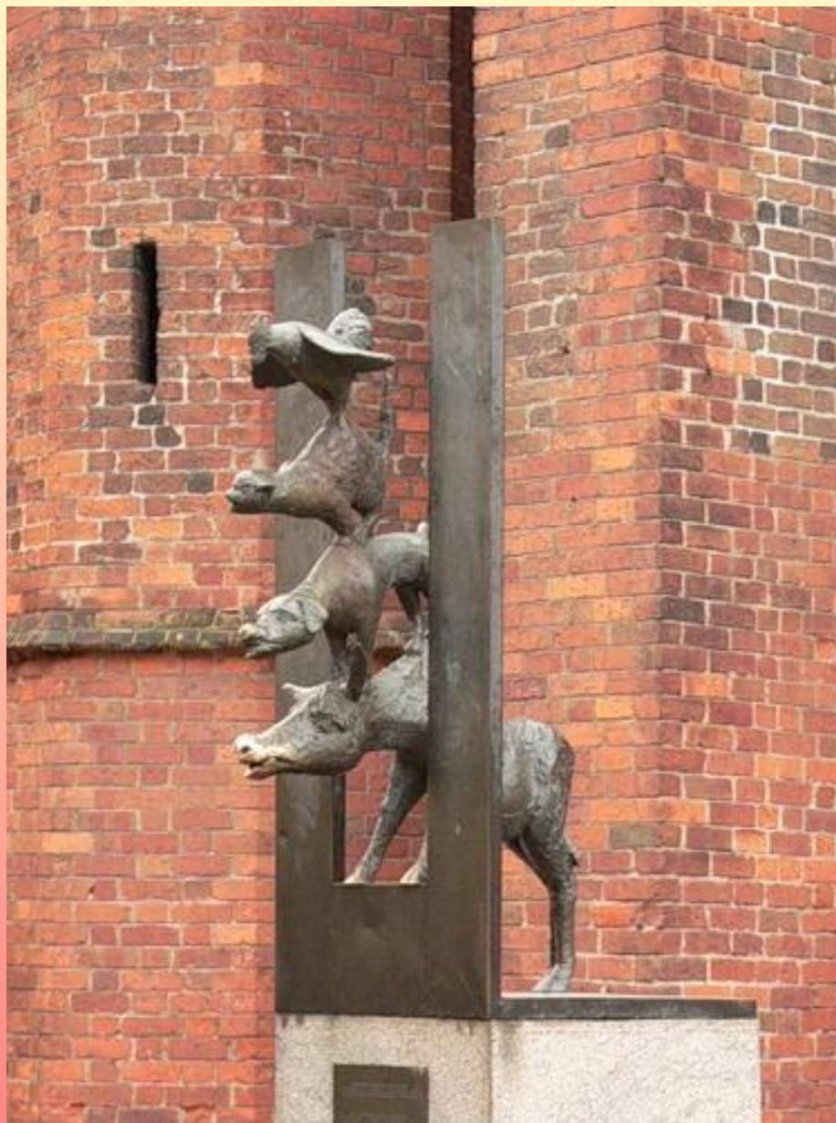
Латвия. Рига. Бременские музыканты.