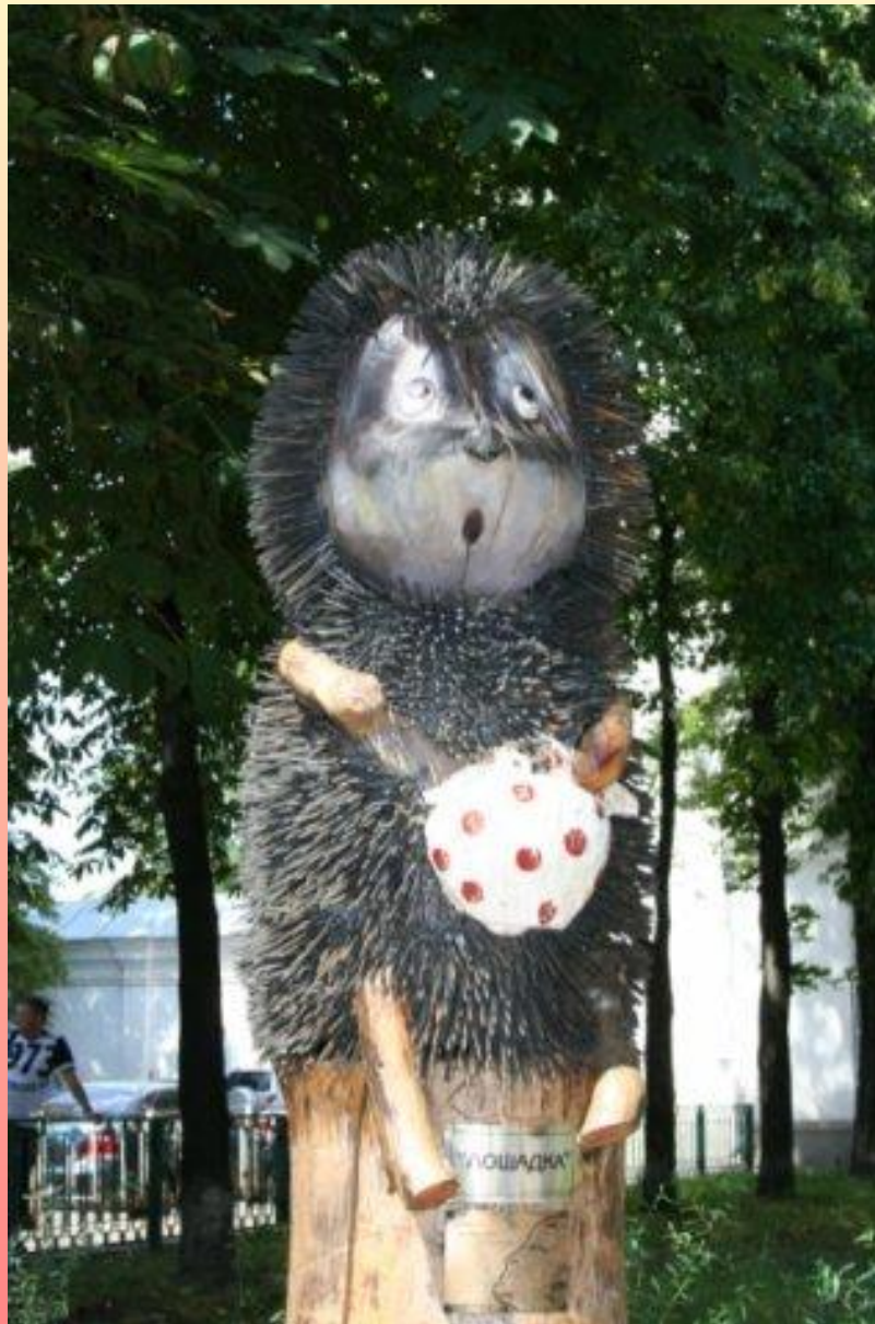
Киев. Памятник ёжику в тумане.