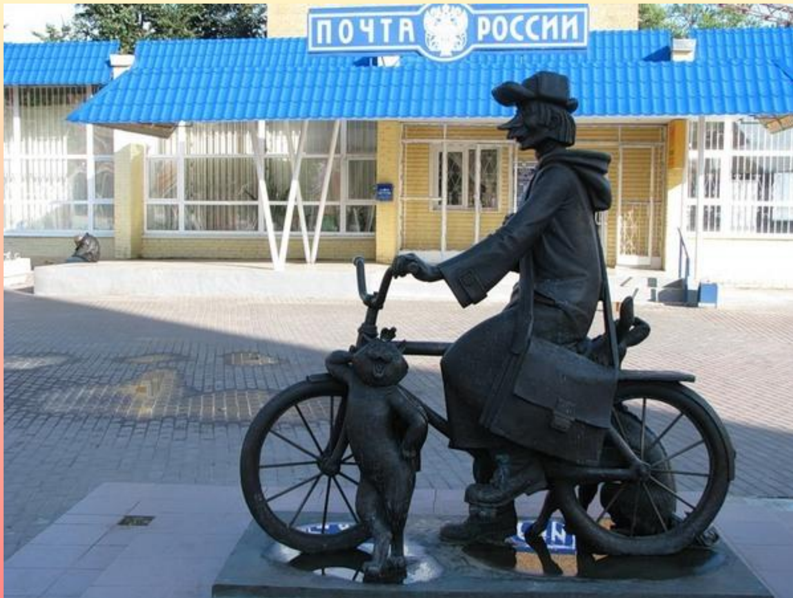
Памятник почтальону Печкину.