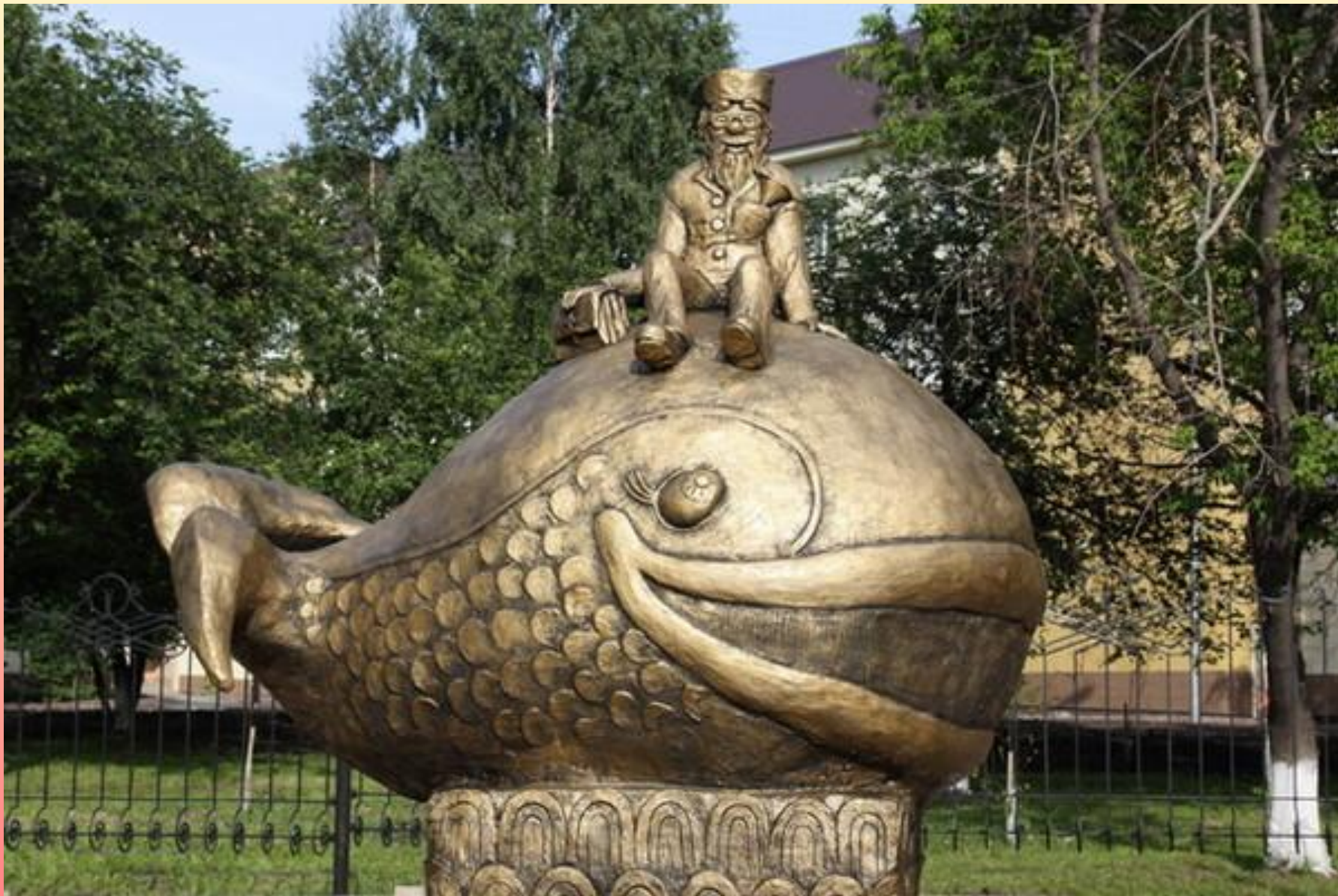
г.Березовский. Памятник доктору Айболиту.