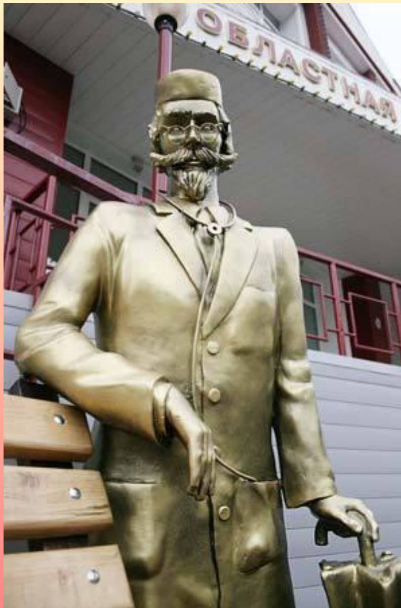
Кемерово. Памятник доктору Айболиту.