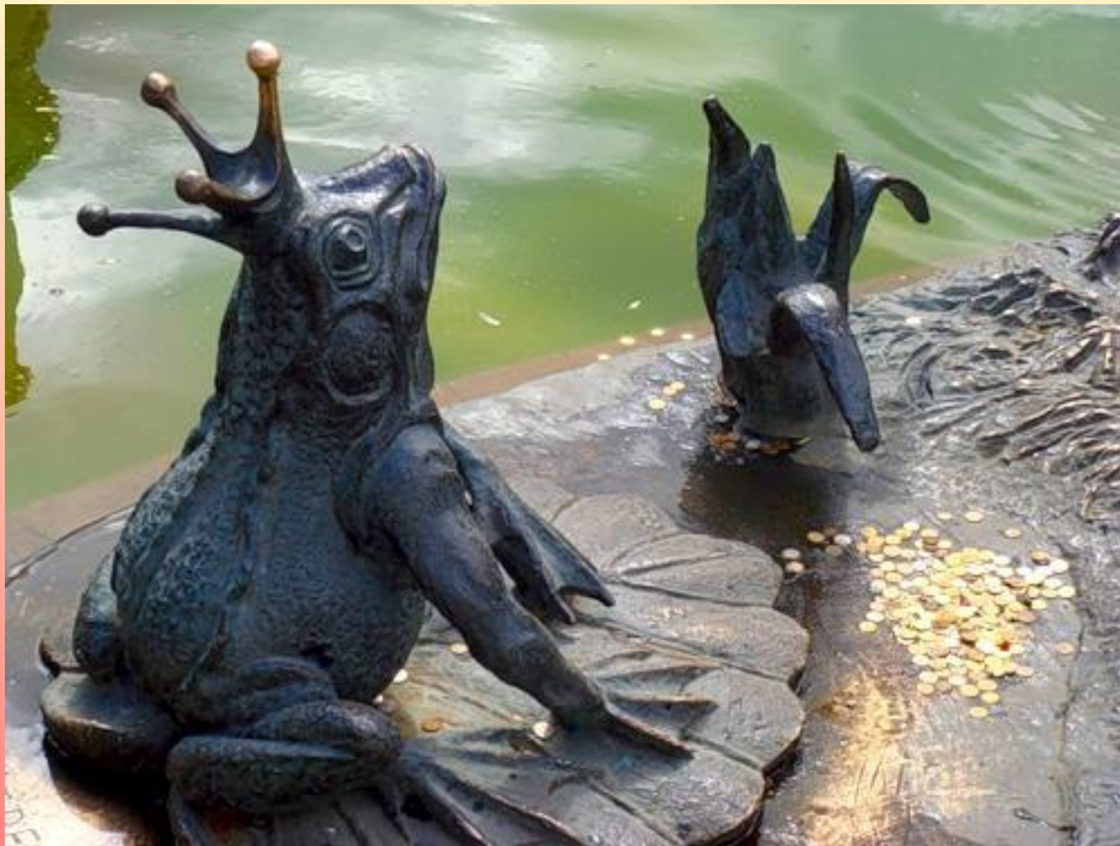
Памятник Царевне Лягушке.