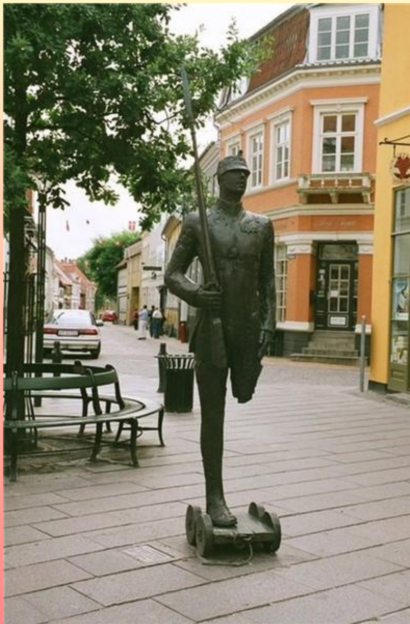
Оденсе. Памятник стойкому оловянному солдатику.