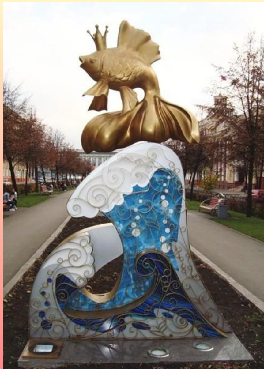
Кемерово. Памятник золотой рыбке.