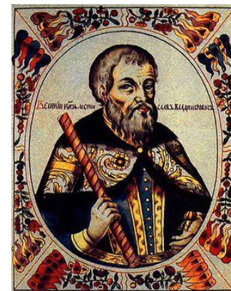
Мстислав Великий (1125-1132)