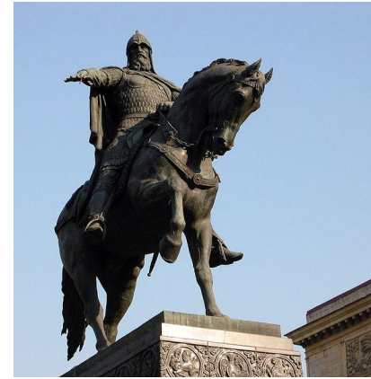
Юрий Долгорукий (1113-1157)