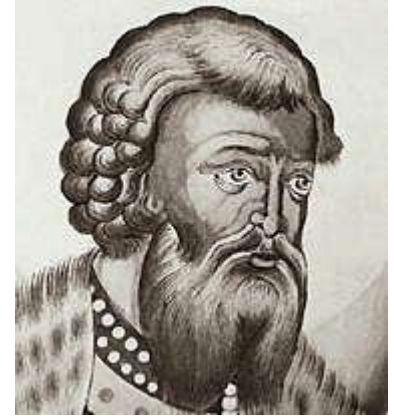
Всеволод Юрьевич (1176-1212)