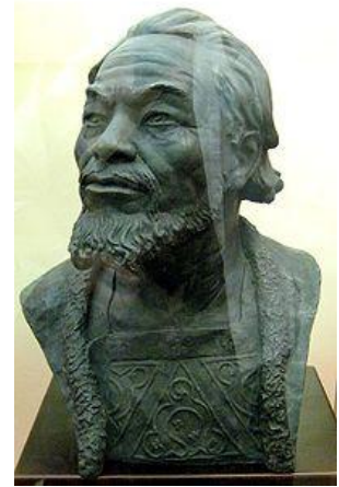
Андрей Боголюбский (1157-1174)