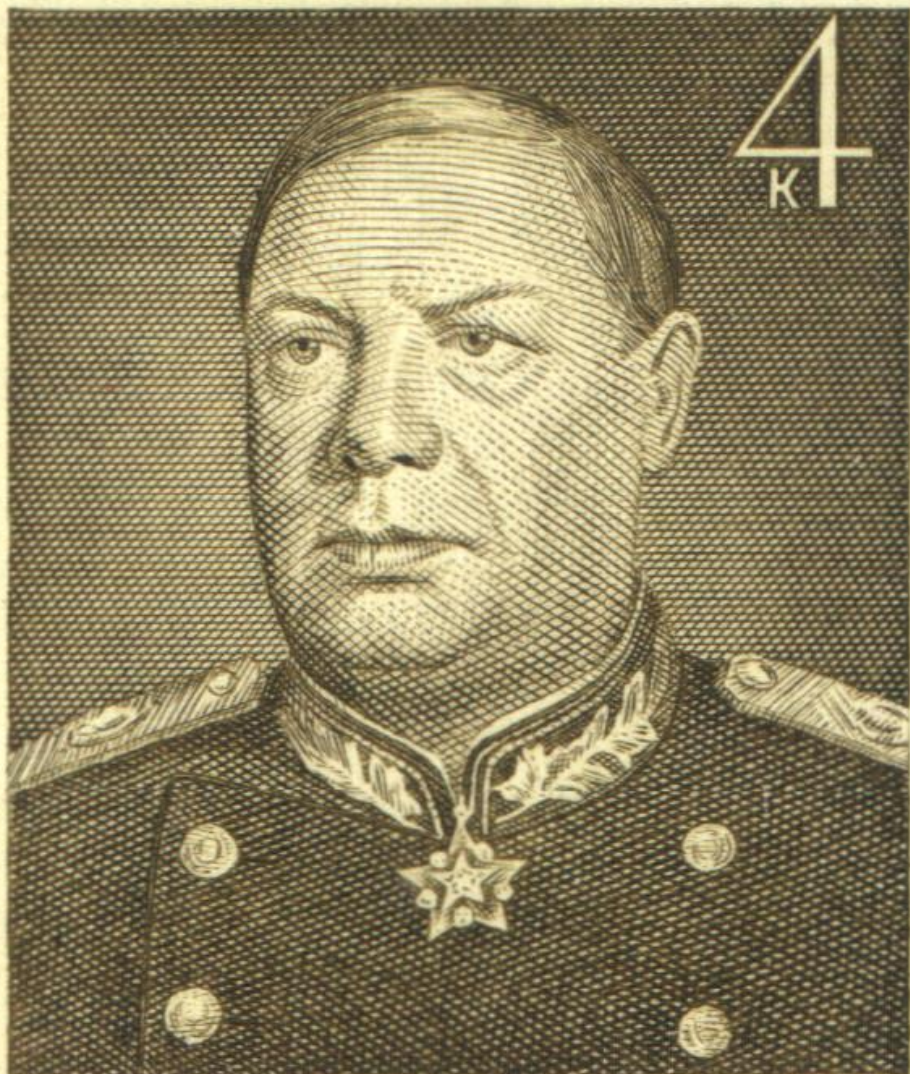
МАРШАЛ СОВЕТСКОГО СОЮЗА Ф.И. ТОЛБУХИН 1894 - 1949