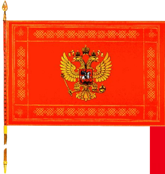
Знамя Сухопутных войск