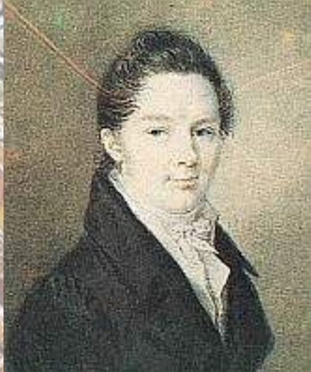
ПУЩИН Иван Иванович (1798-1859)