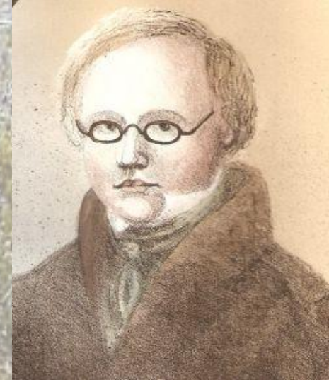
ДЕЛЬВИГ Антон Антонович (1798-1831)