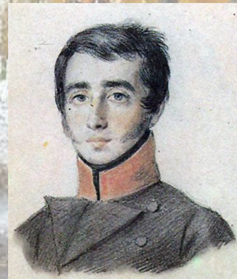
КЮХЕЛЬБЕККЕР Вильгельм Карлович (1797 – 1846)