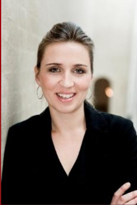
Премьер-министр Дании Метте Фредериксен с 27 июня 2019 г.