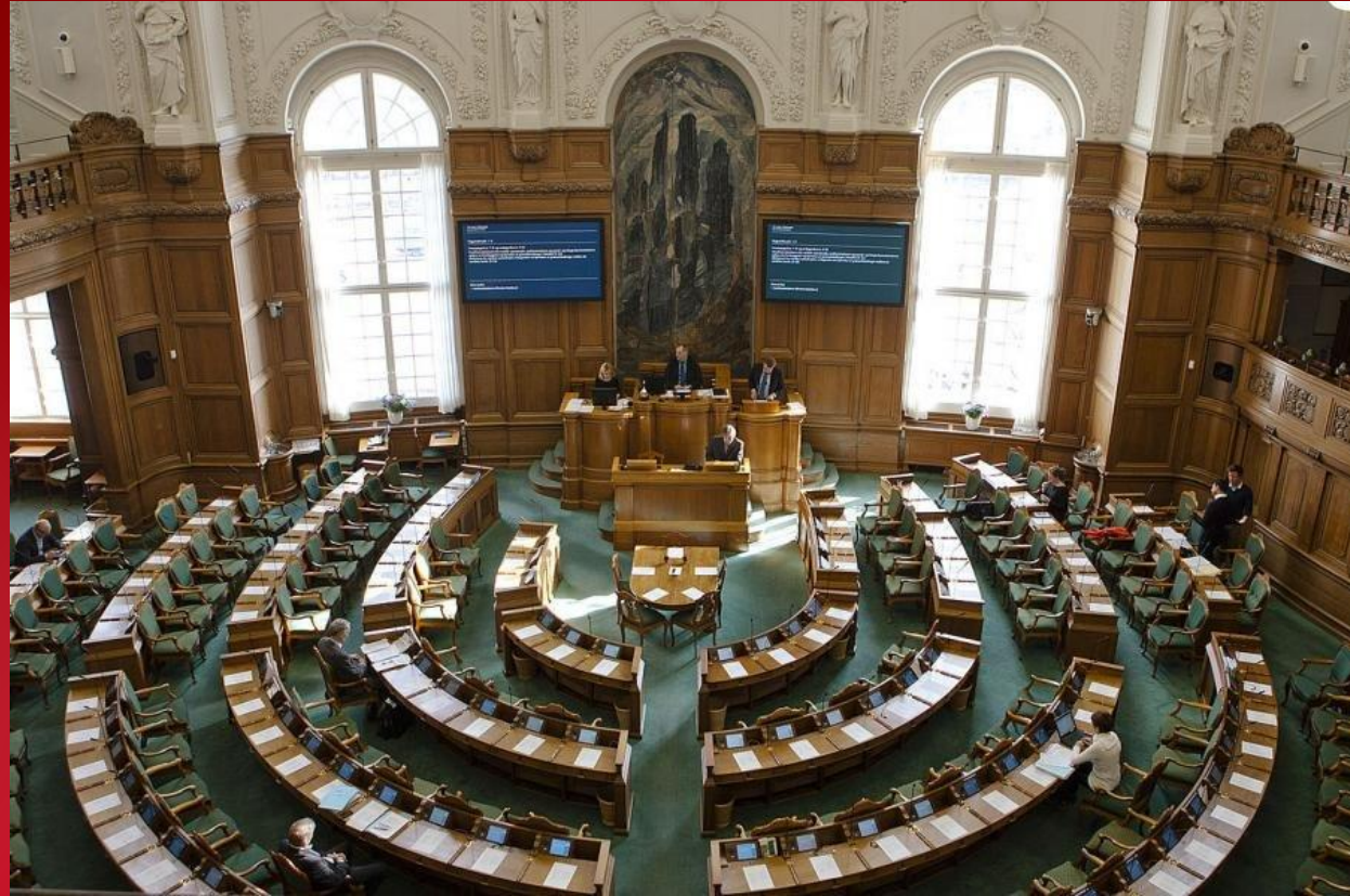
Кабинет парламента Дании.