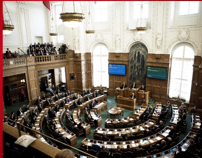
Кабинет парламента Дании.