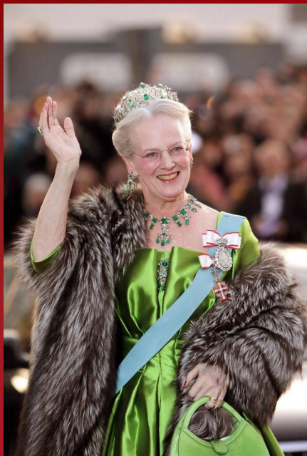
Королева Дании Маргрете II С 14 января 1972 г.

▶ Согласно конституции от 5 июня 1953 г., глава государства — королева Маргрете II, вступившая на трон в январе 1972 г., осуществляющая формально законодательную власть совместно с однопалатным парламентом — фолькетингом, избираемым гражданами страны на 4 года. Решения парламента являются окончательными, он не подотчётен никому. Согласно Конституции, силовые действия против Фолькетинга являются гос. изменой.