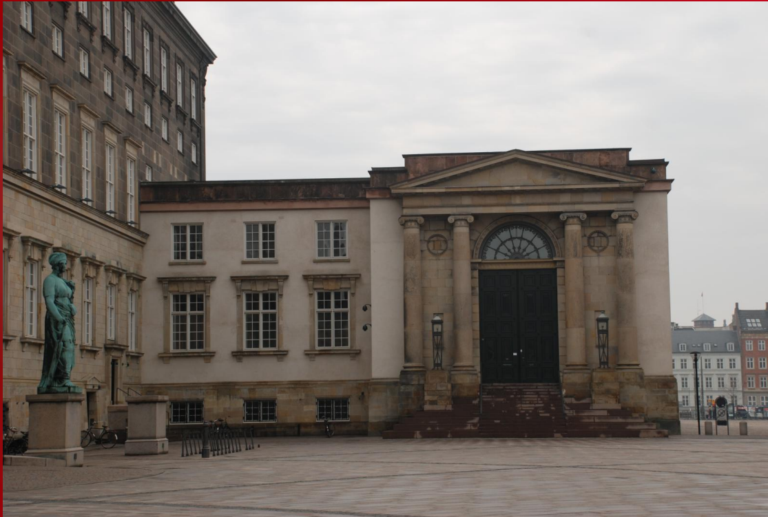
Здание верховного суда.