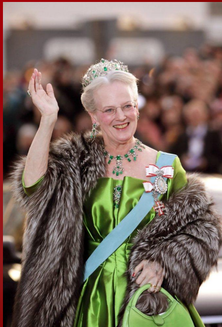
Королева Дании Маргрете II

Король (королева) назначает Премьер-министра, опираясь на мнение народа в лице лидеров парламентских партий. Кандидатура Премьер-министра проходит процедуру голосования о доверии в парламенте.