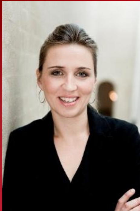
Премьер-министр Дании Метте Фредериксен