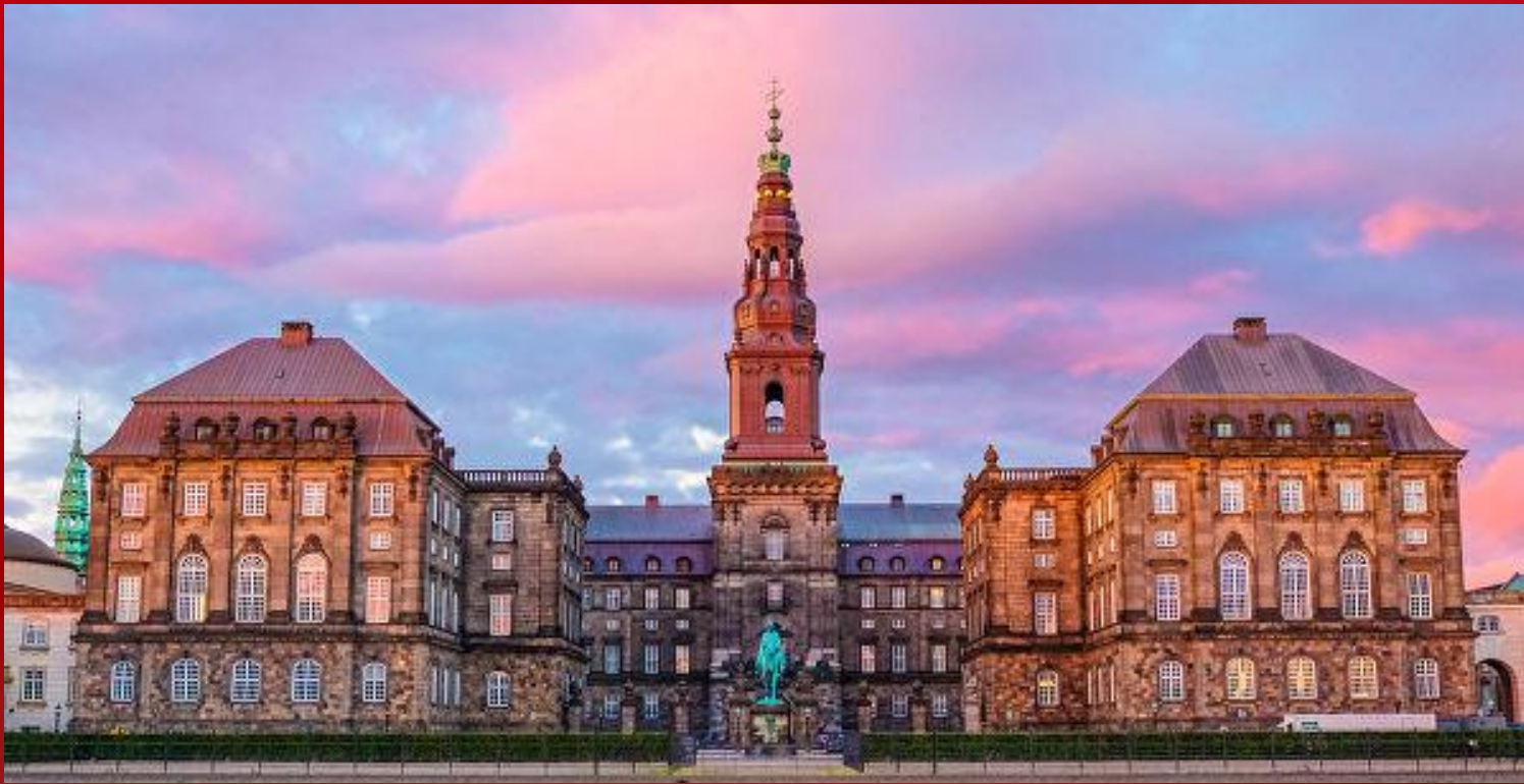
Здание правительства Дании