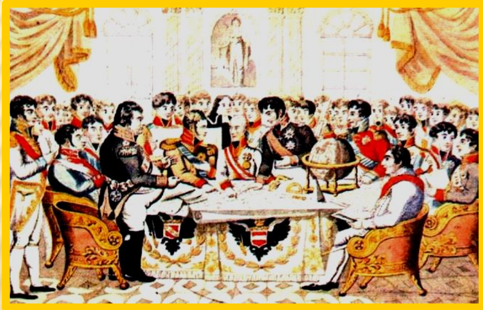
Європейські монархи ділять Європи. Карикатура