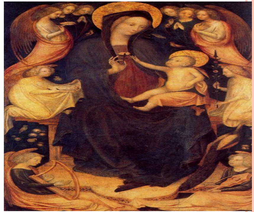
Vierge à l'Enfant

du xv e siècle en Allemagne. Il est né vers 1380 dans la région de la Rhénanie inférieure ou dans la province hollandaise de la Gueldre, à Zutphen, et est mort vers 1440, vraisemblablement à Hambourg, où son activité est documentée à la fin de sa carrière