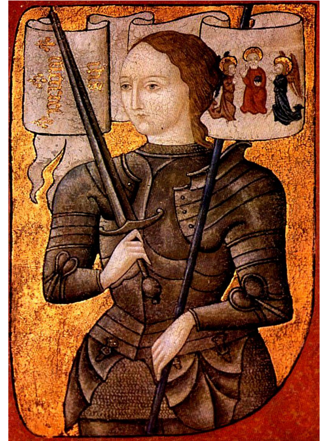
Miniature de Jeanne d'Arc, vers 1450.

Les images ont été créées dans le but d'éduquer les fidèles qui ne savent ni lire ni écrire. L'art gothique transmet un ensemble de règles civiques et morales ; cela sert à conserver l'équilibre social. Il doit être simple et accessible à tous.