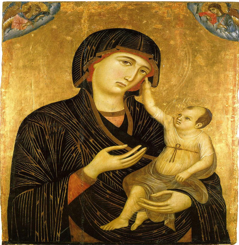
Madonna di Crevole

André Beauneveu , né vers 1335 dans le comté de Hainaut à Valenciennes et mort vers 1400 à Bourges, est un peintre, un sculpteur et un enlumineur actif de 1359 à 1390, qui a travaillé au service du roi de France Charles V et de son frère le duc Jean de Berry. Son œuvre constitue un jalon entre la tradition gothique et le courant réaliste de son contemporain Claus Sluter.