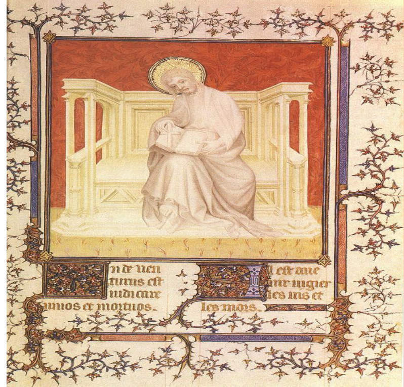
Saint Philippe dans le Psautier de Jean de Berry

Duccio di Buoninsegna fut en son temps le plus grand peintre siennois ; son importance se mesure même à l'échelle européenne. On considère généralement que son influence fut déterminante dans l'évolution du style gothique international ; elle s'exerça en particulier sur Simone Martini et les deux frères Ambrogio et Pietro Lorenzetti.