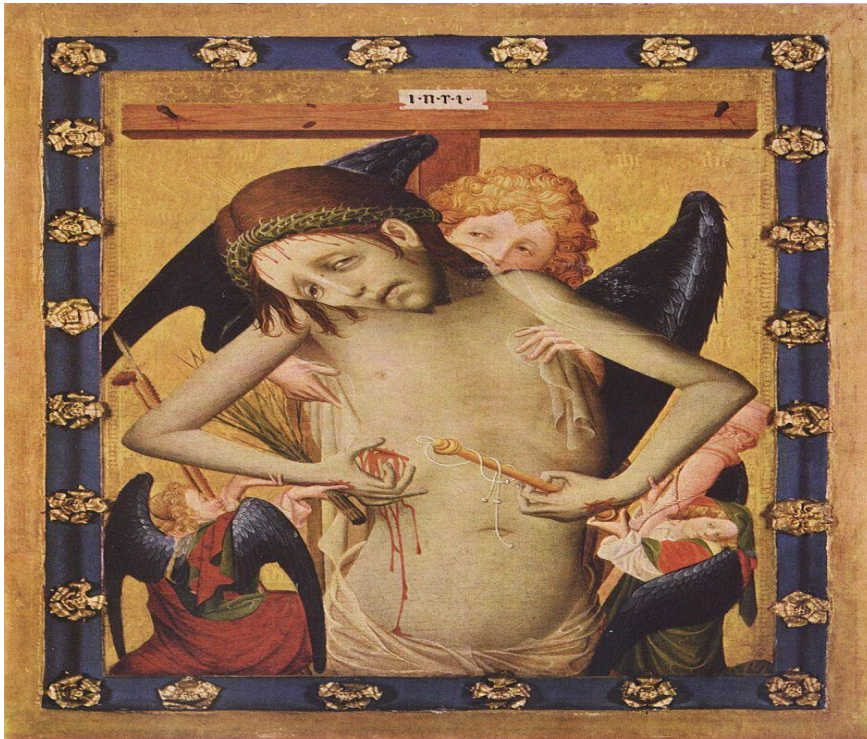
L'Homme de douleurs

Stefano da Verona (1379 – 1438 env.) est un peintre italien de style gothique qui a été actif à Vérone.