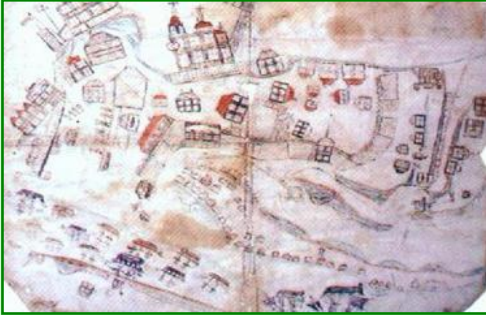
Ситка. Столица Русской Америки. Акварель сер.19 века

При Александре I Россия укрепилась в Америке. В 1804 г. на Аляске возник Новоархангельск. В 1808 г. были установлены дипломатические отношения с США. В 1812 г. основана русская колония в Калифорнии.