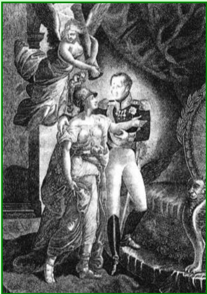
Александр I восстанавливает монархию во Франции. Гравюра 19 в.

Для решения вопросов послевоенного устройства Европы был созван Венский Конгресс.