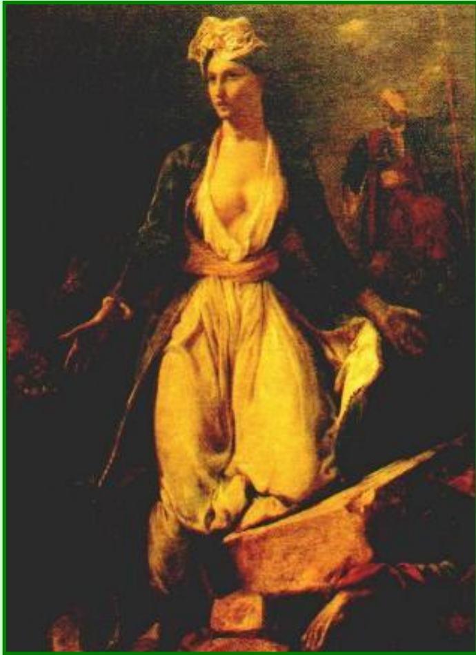
Э.Делакруа. Греческая революция

В конце 20-х г. Союз распался из-за противоречий по Восточному вопросу.