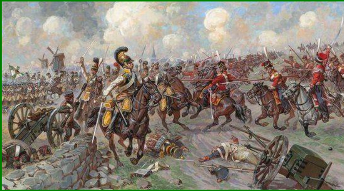
«Битва народов» под Лейпцигом

В это время Наполеон собрал новые войска и в конце апреля нанес союзникам поражения при Люцене и Бауцене и смог заключить перемирие.