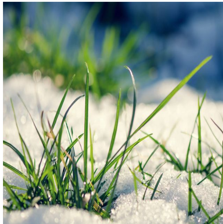
Появляется первая трава