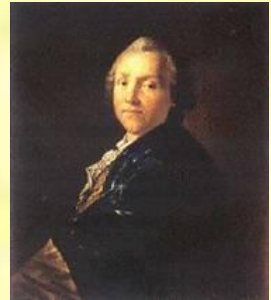
Александр Петрович Сумароков