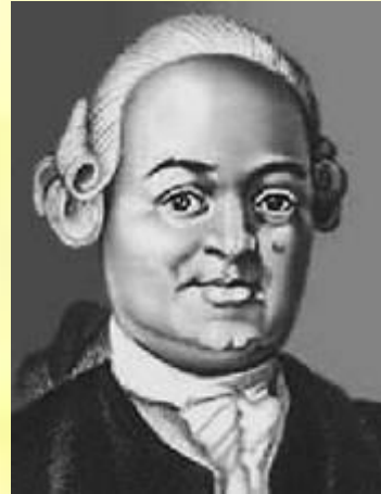
Василий Кириллович Тредиаковский