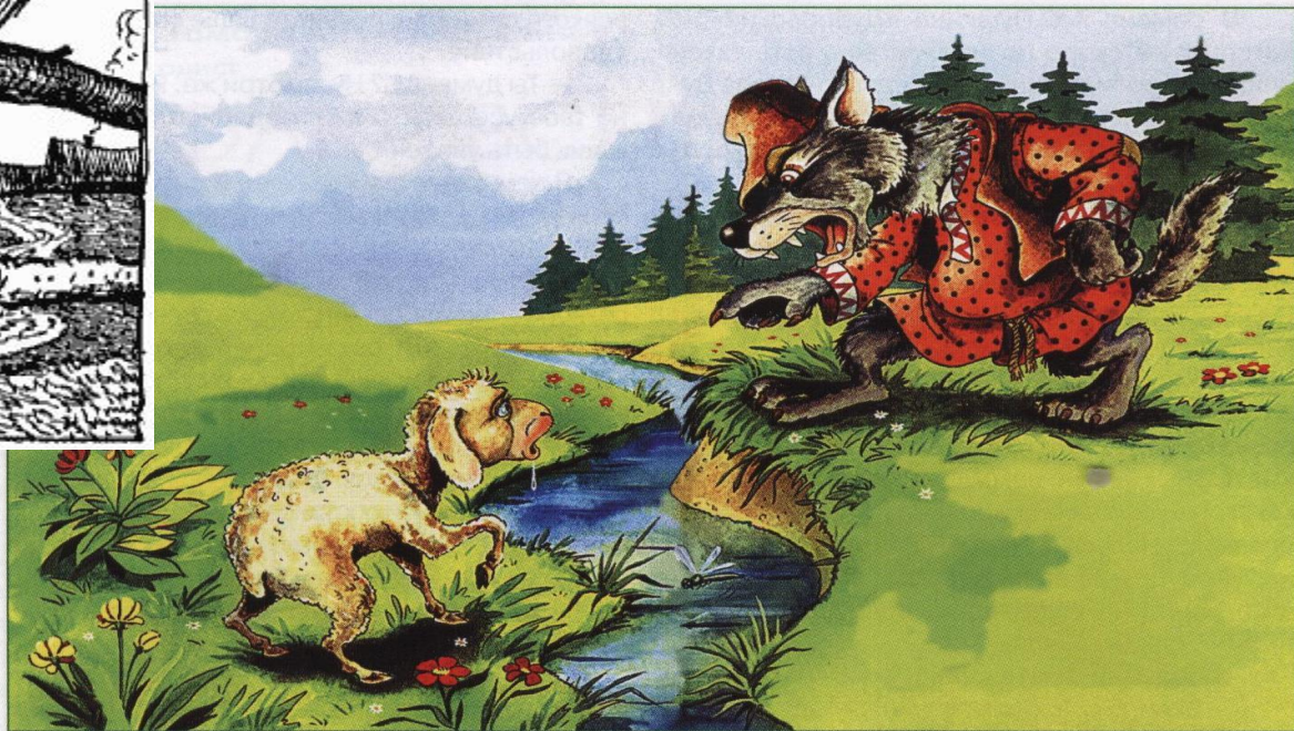
В. Кастальский. Иллюстрация к басне «Волк и Ягненок»