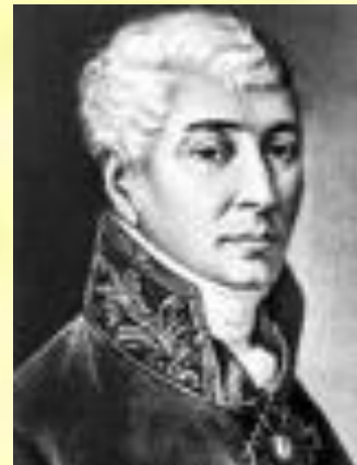
Иван Иванович Дмитриев