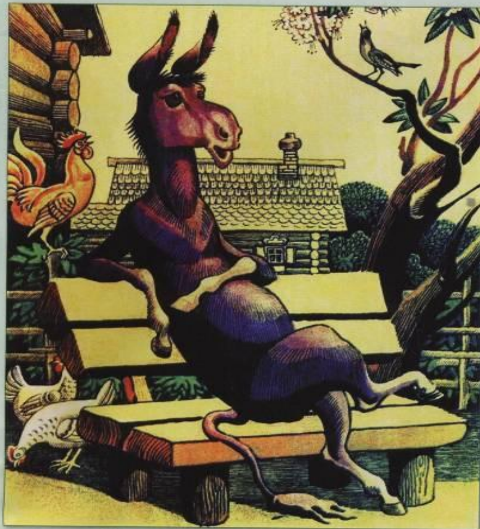
С.Артюшенко. Иллюстрация к басне «Осел и Соловей»