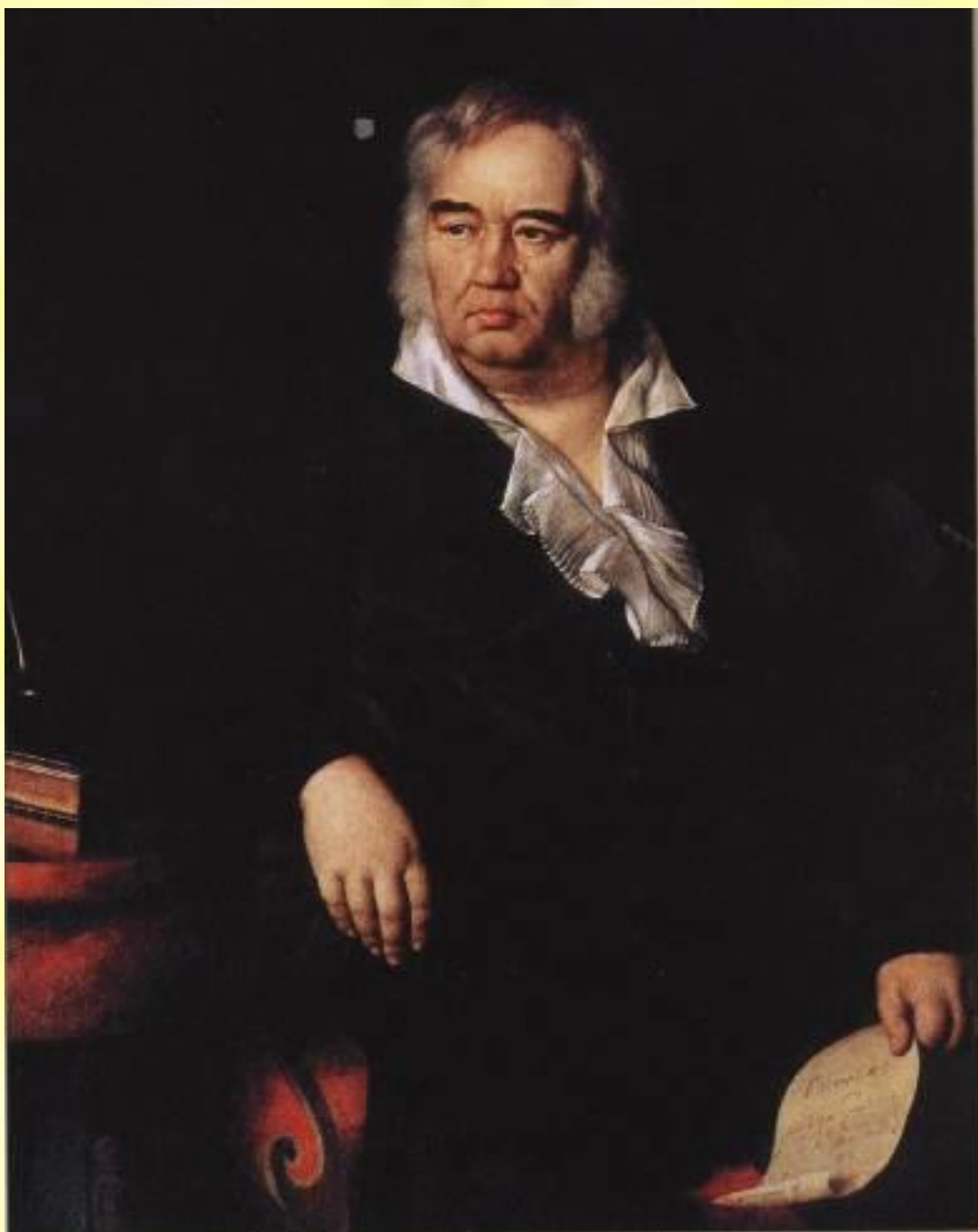
И.Э.Эггинк. Портрет баснописца И.А.Крылова.