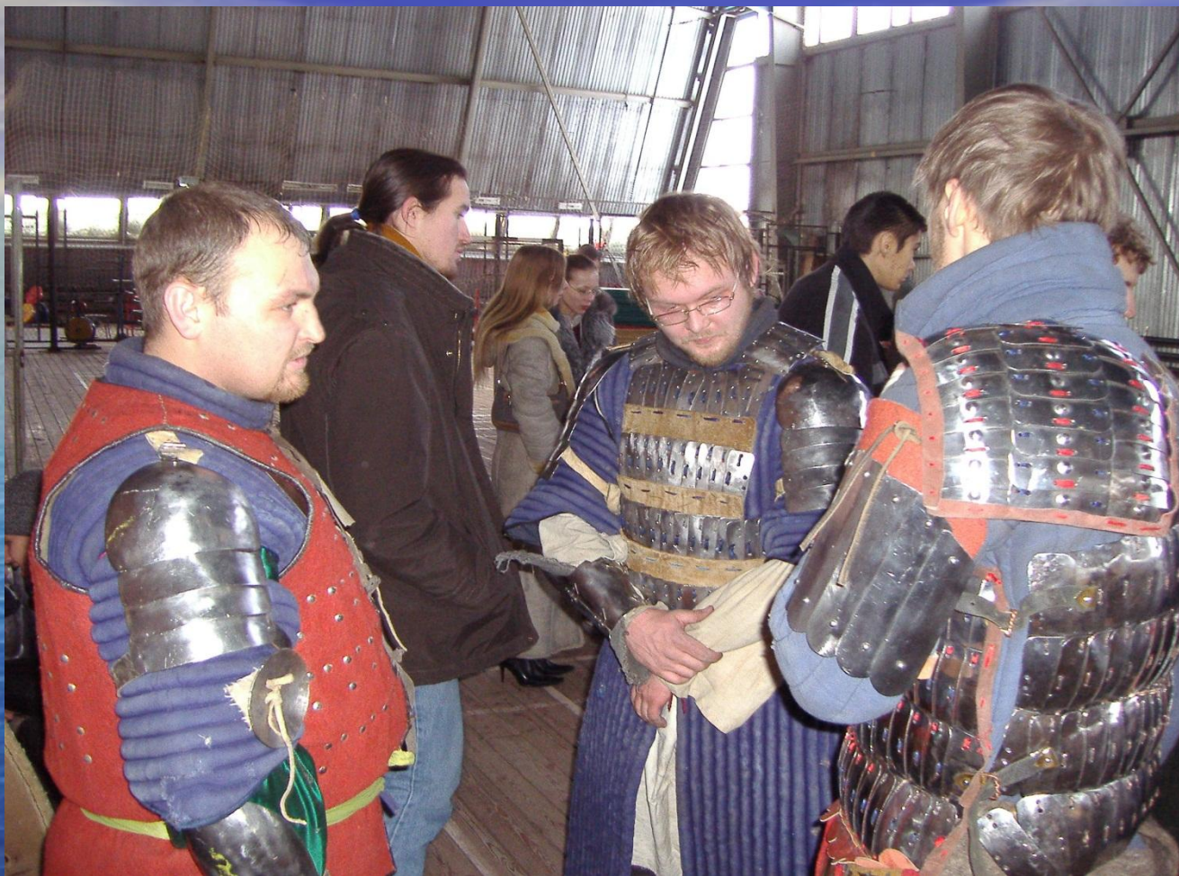
Турнир по историческому фехтованию Рубеж-2005. Иркутск.