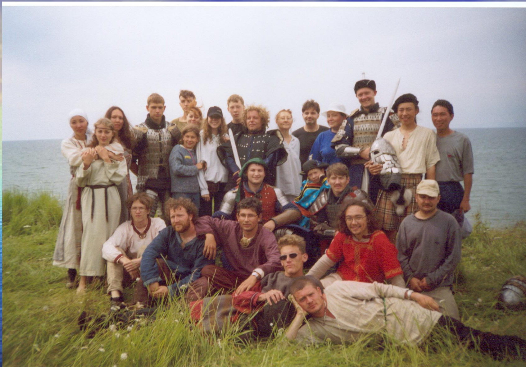
Участники фестиваля «Лик волка-2004». Байкал.