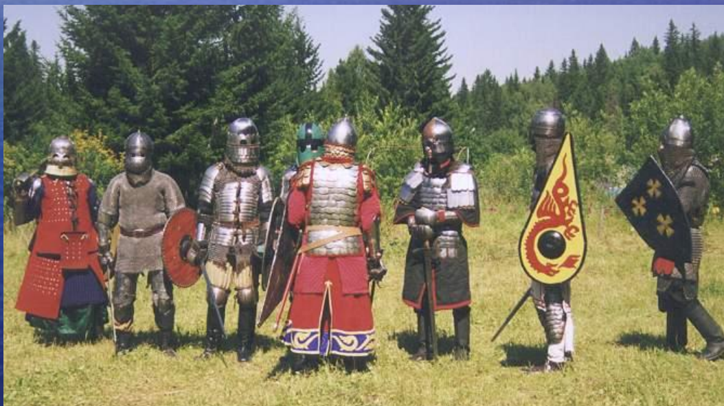
Турнир по историческому фехтованию «Меч Сибири – 2003». г. Красноярск.