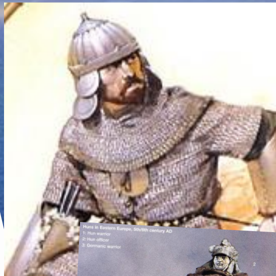
Plate 11 Eastern Europe, 5th/6th century AD 1: Hun warrior 2: Hun officer 3: Germanic warrior