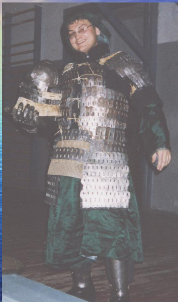
Рубеж-2002, г. Иркутск.

Члены команды регулярно принимают участие в военно-исторических фестивалях и турнирах по историческому фехтованию