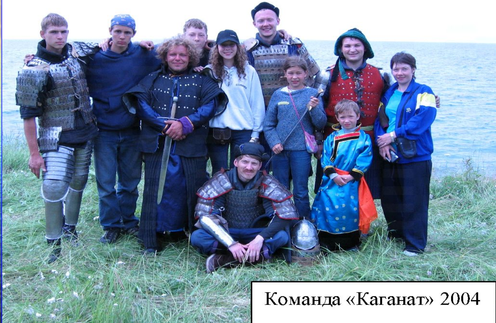
Команда «Каганат» 2004