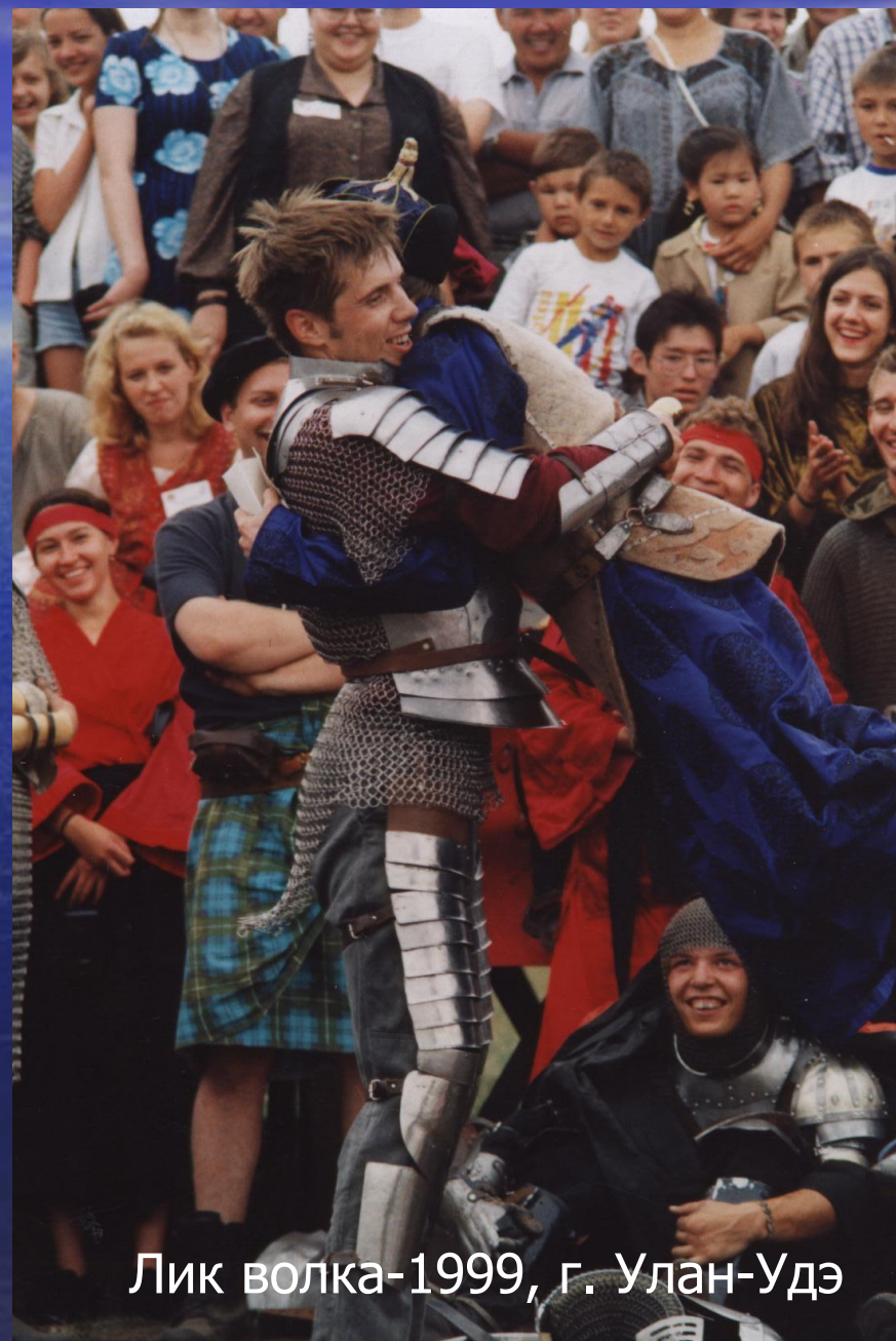
Лик волка-1999, г. Улан-Удэ

С 1998 по 2007 гг. было проведено 5 фестивалей клубов исторического моделирования Сибири и Дальнего Востока.