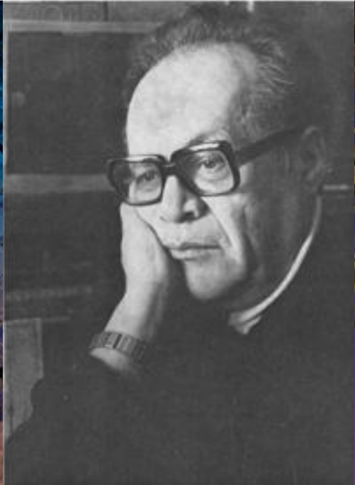
Миха́йл Льво́вич Матусо́вский

Композитор – Владимир Яковлевич Шайнский