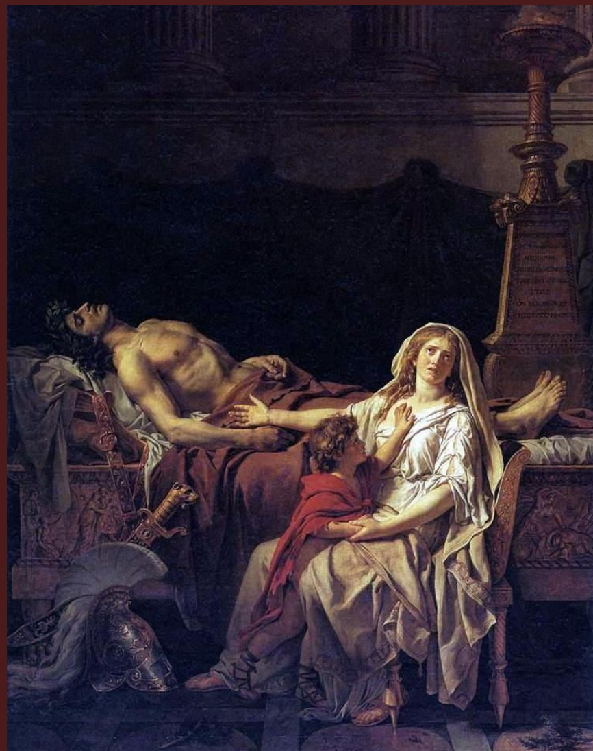
Жак-Луи Давид. «Андромаха оплакивающая Гектора», 1783