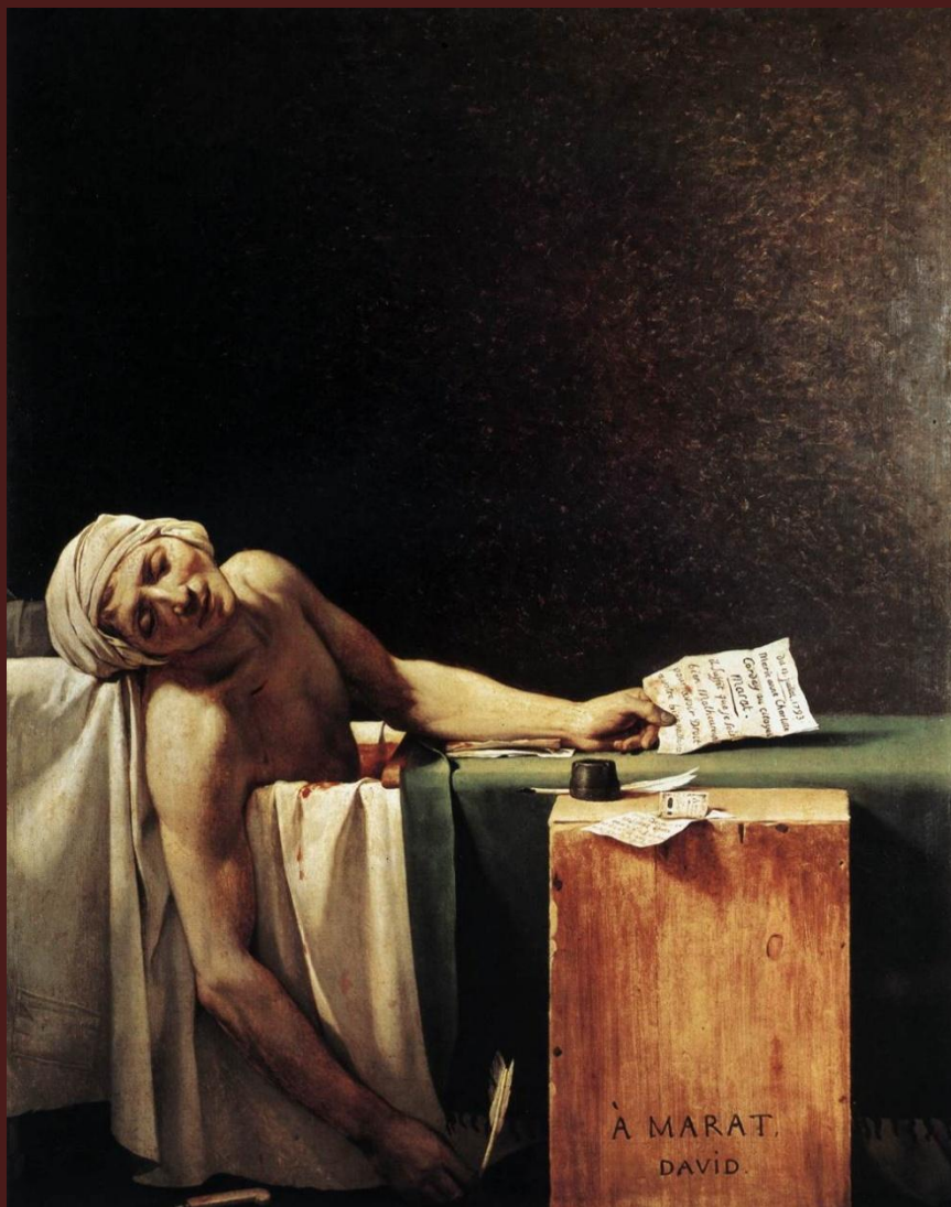
Жак-Луи Давид. «Смерть Марата», 1793