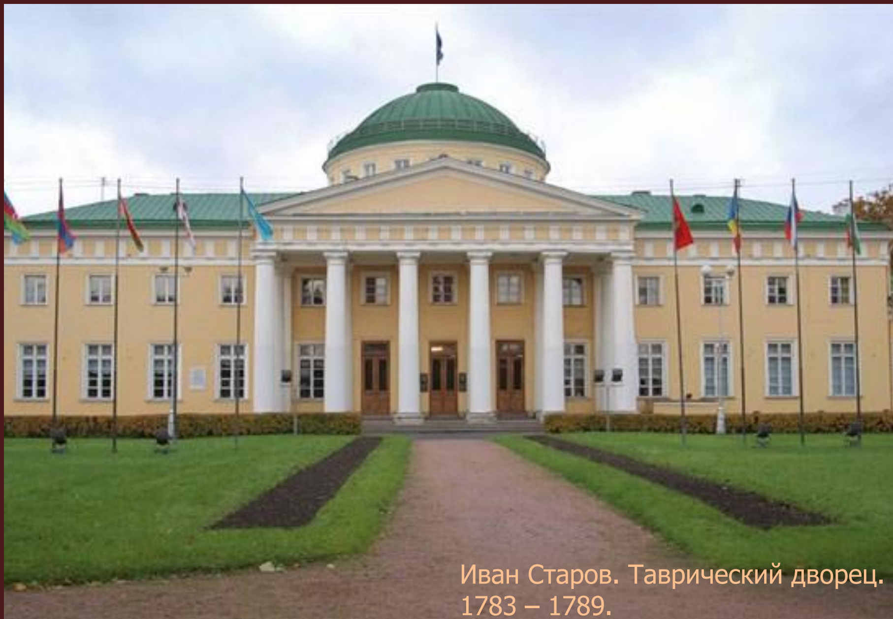
Иван Старов. Таврический дворец. 1783 – 1789.