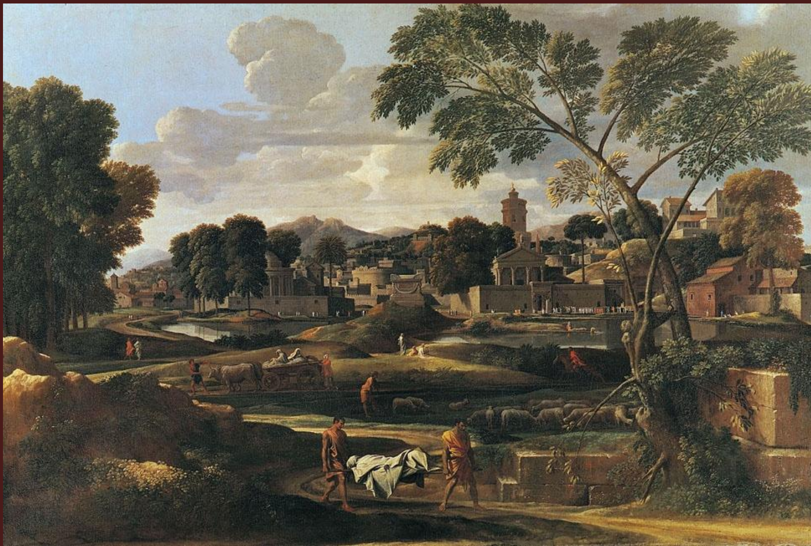
Никола Пуссен. «Пейзаж с похоронами Фокиона», 1638