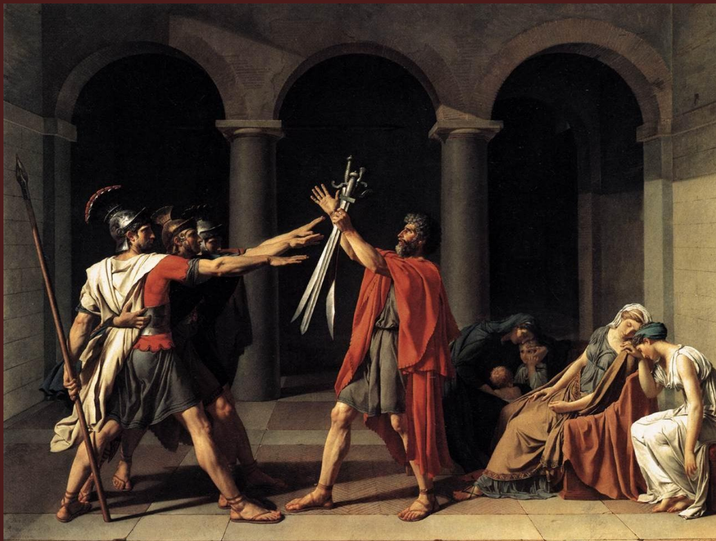
Жак-Луи Давид. «Клятва Горациев», 1784