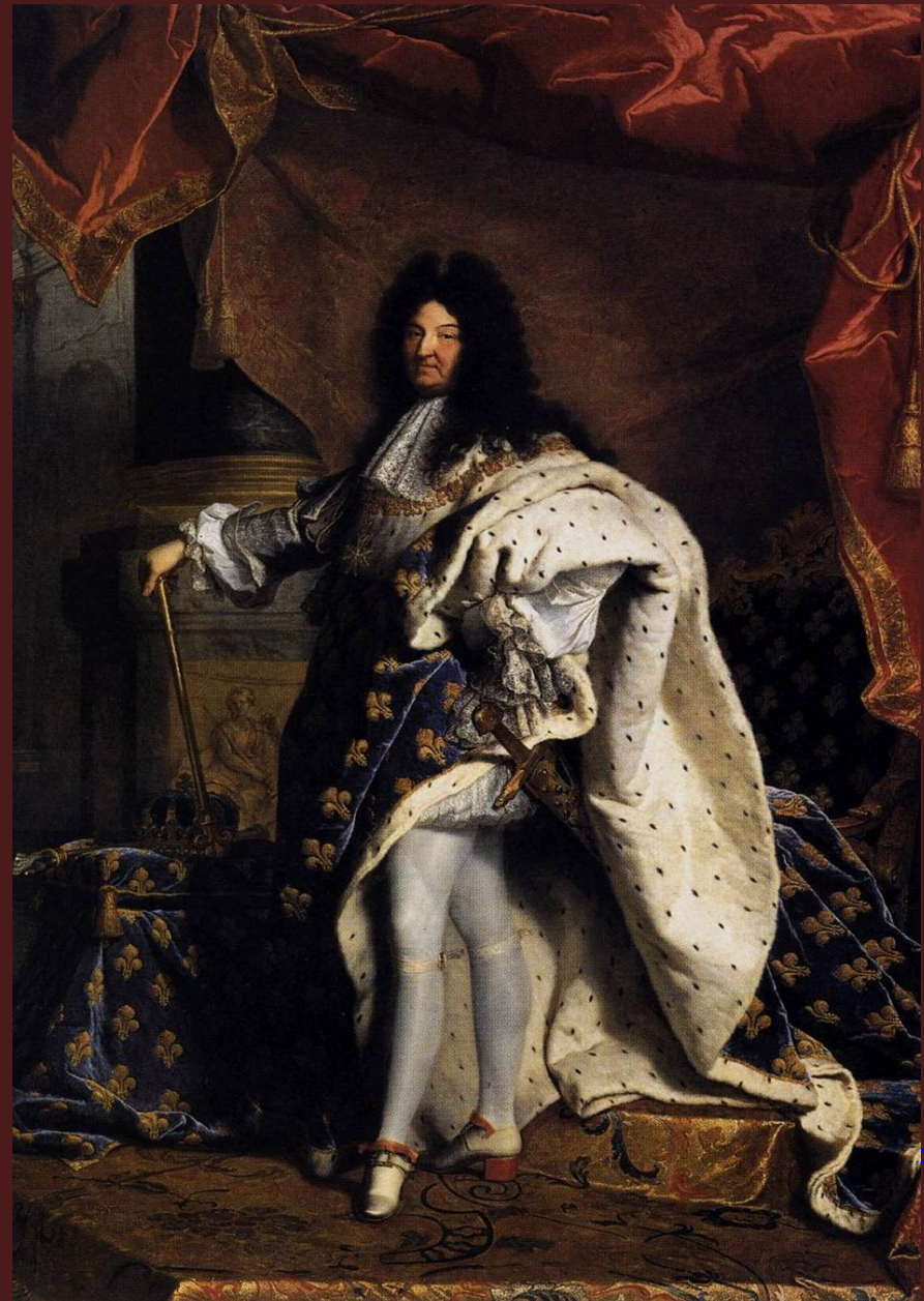
Гиацинт Риго. «Людовик XIV», 1701

Появление классицизма обычно связывают со становлением абсолютной монархии.