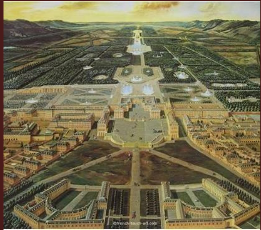
Дворцово-парковый ансамбль Версаля (1661–1689)

Французский парк – это парк регулярный, где природа подчинена строгой архитектонике зодчего. Дорожки выровнены, аллеи прямы как стрелы, трава подстрижена, водоем имеет правильные геометрические очертания, кронам деревьев приданы правильные конусообразные или шаровидные формы.