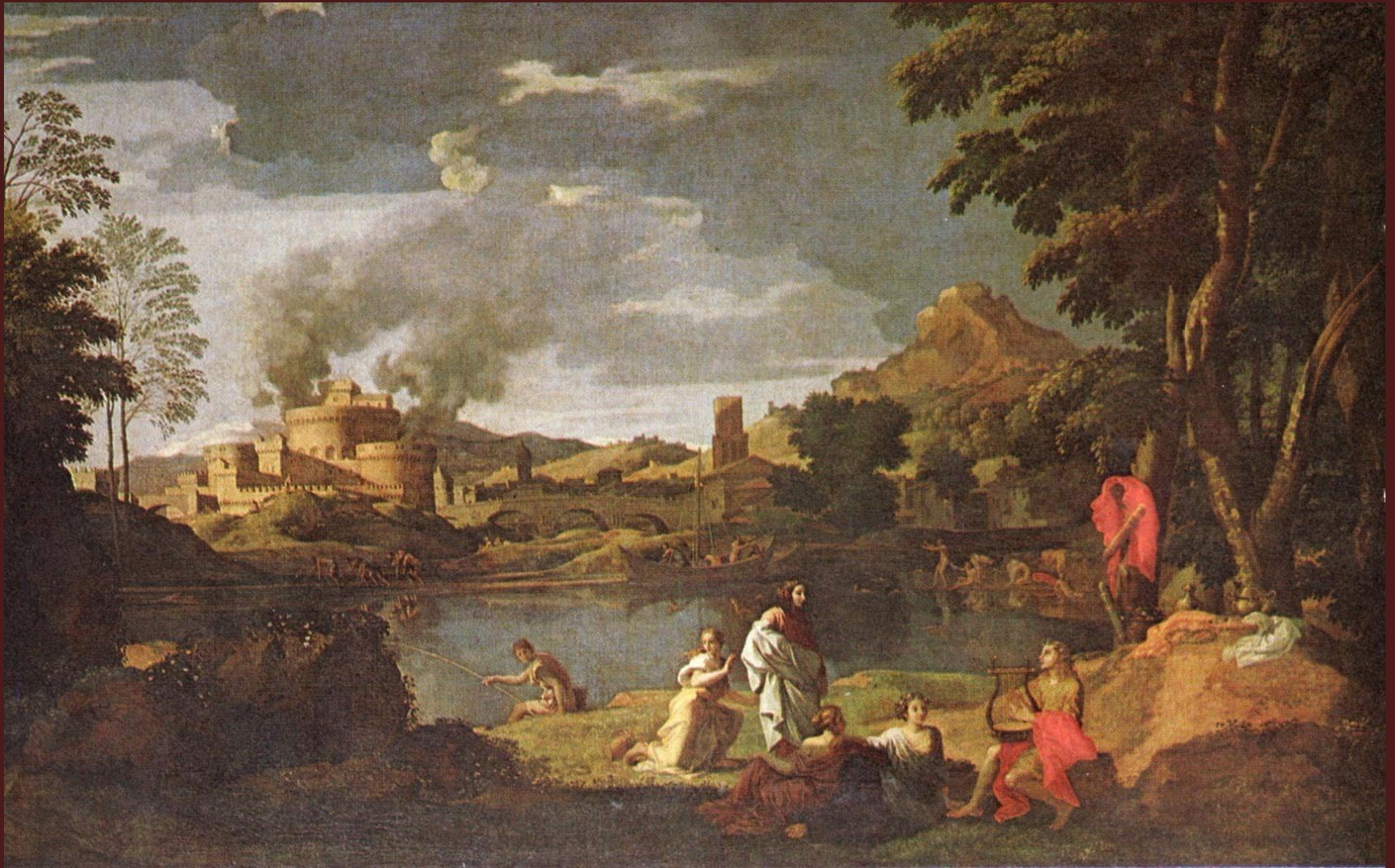
Никола Пуссен. Пейзаж с Орфеем и Эвридикой. 1648