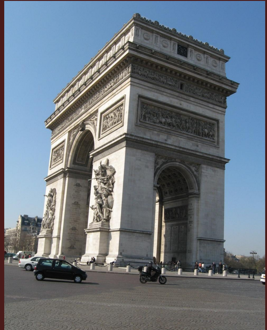
Триумфальная арка в Париже