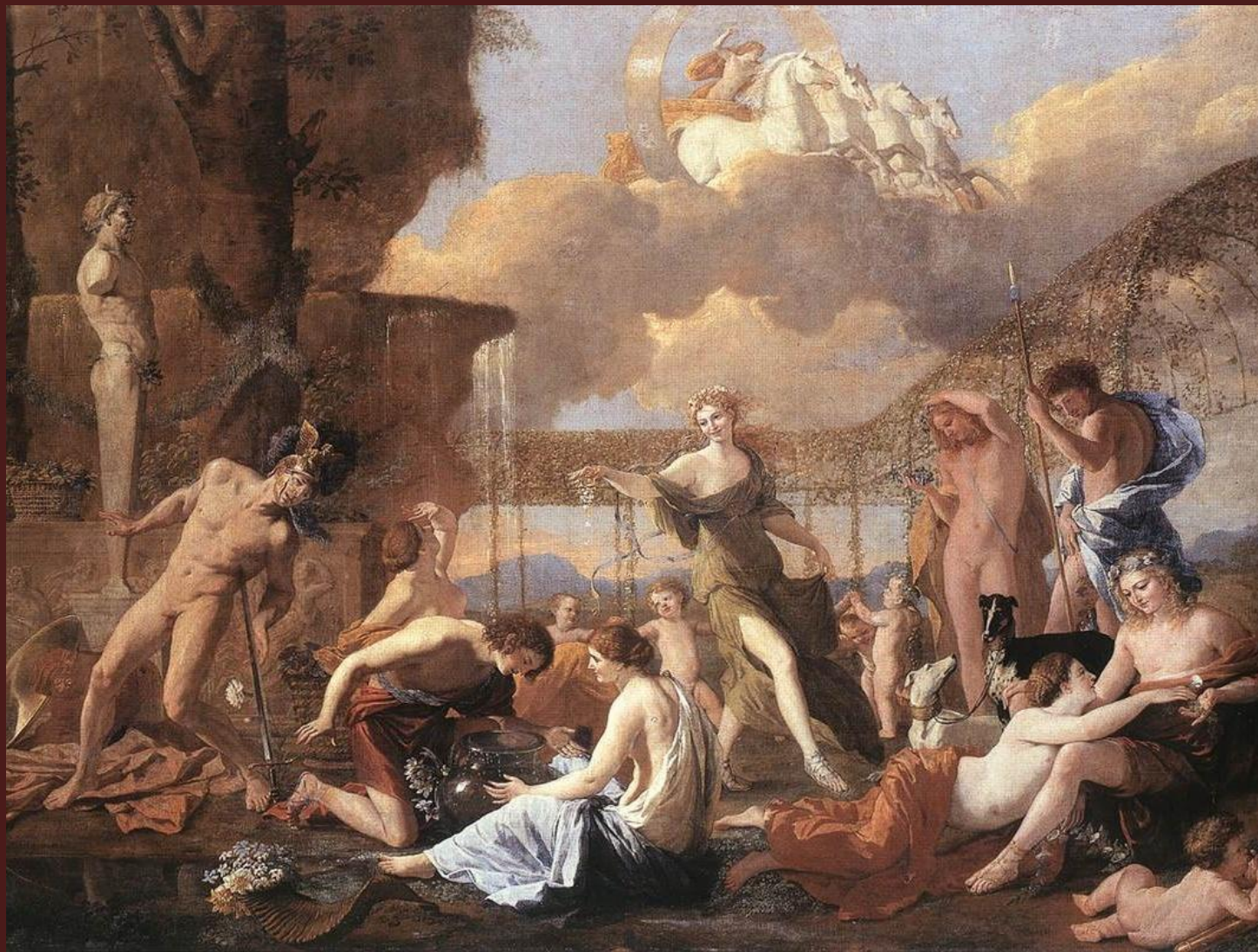
Никола Пуссен. «Царство Флоры», 1631