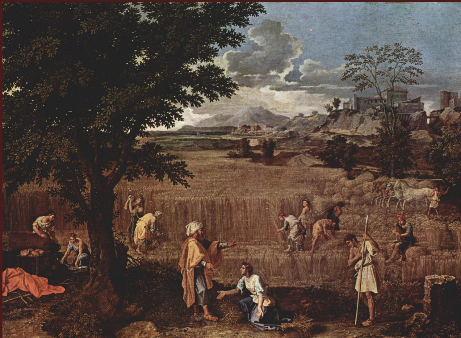
Никола Пуссен. «Четыре времени года. Лето», 1660–1664