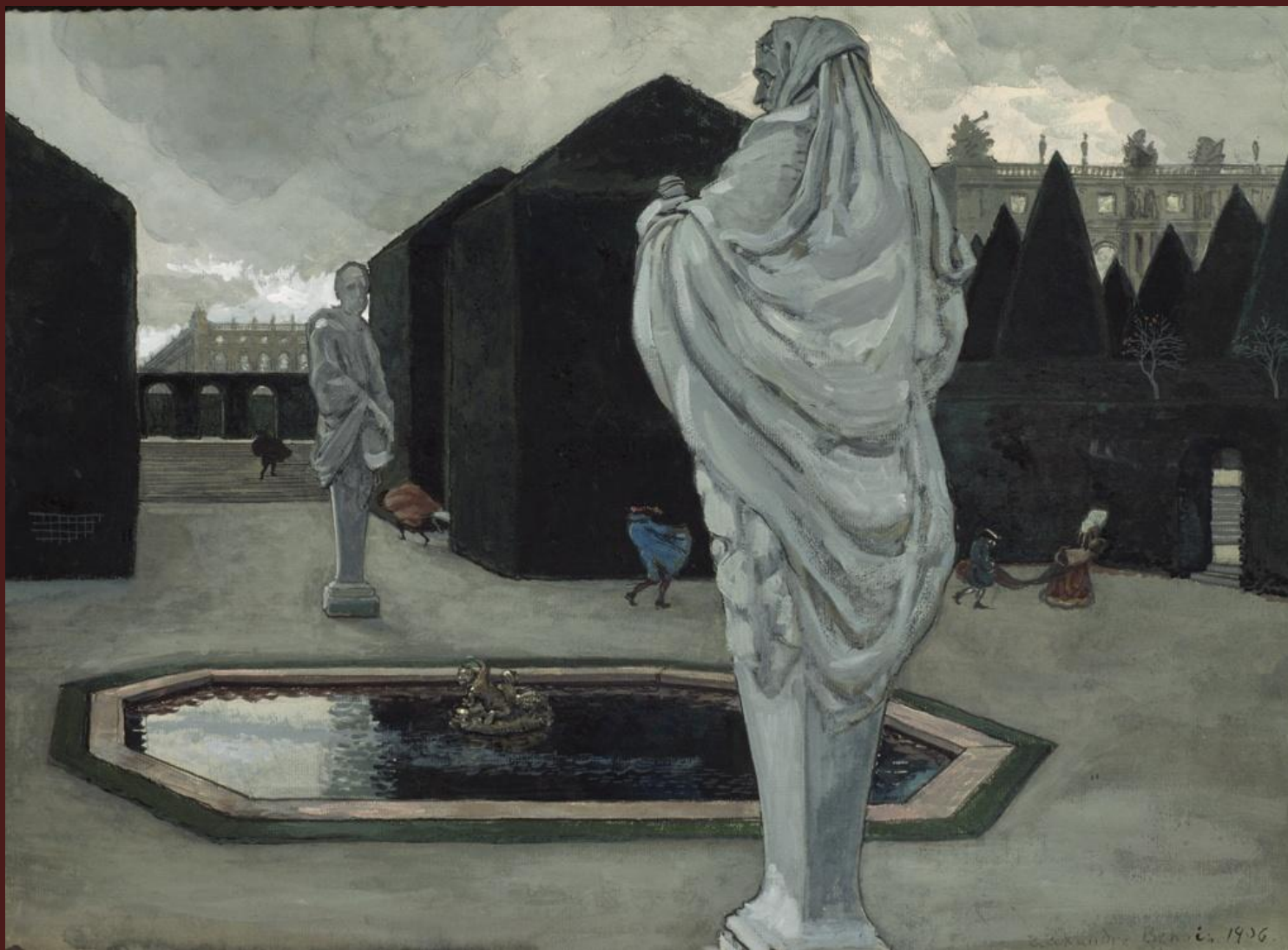
Александр Бенуа. «Фантазия на версальскую тему», 1906