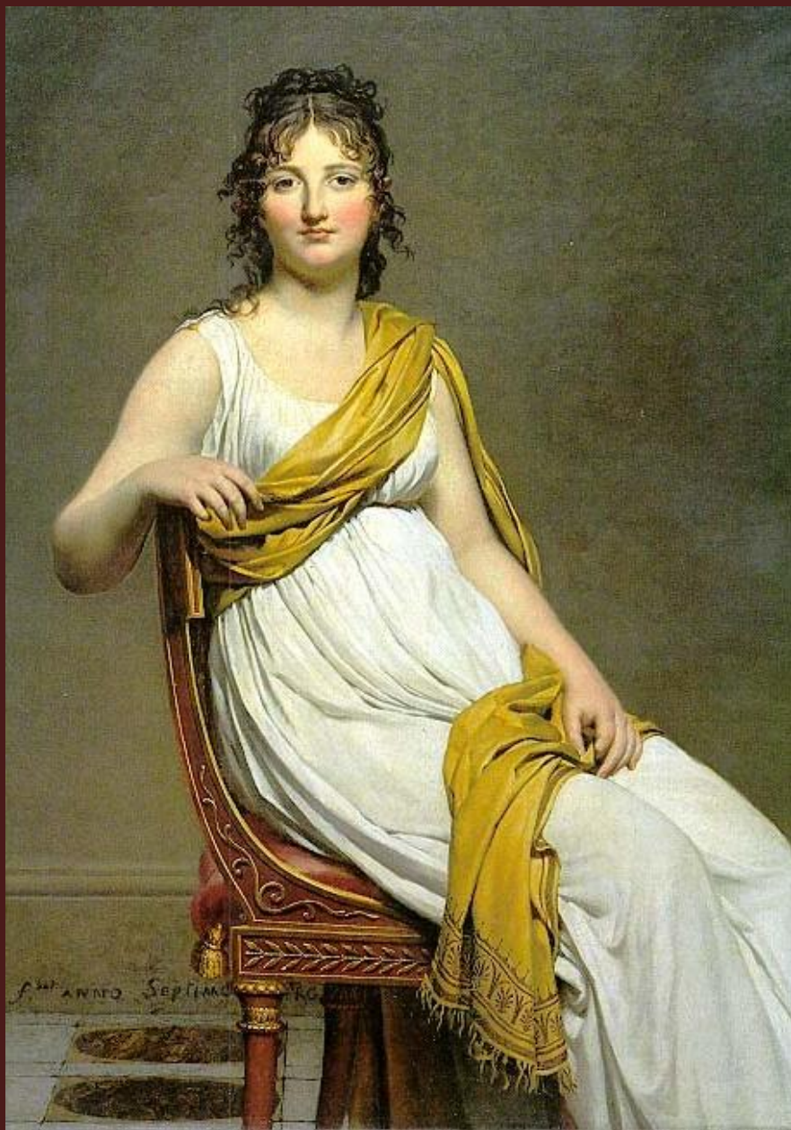
Жак-Луи Давид. «Портрет мадам де Вернинак», 1799