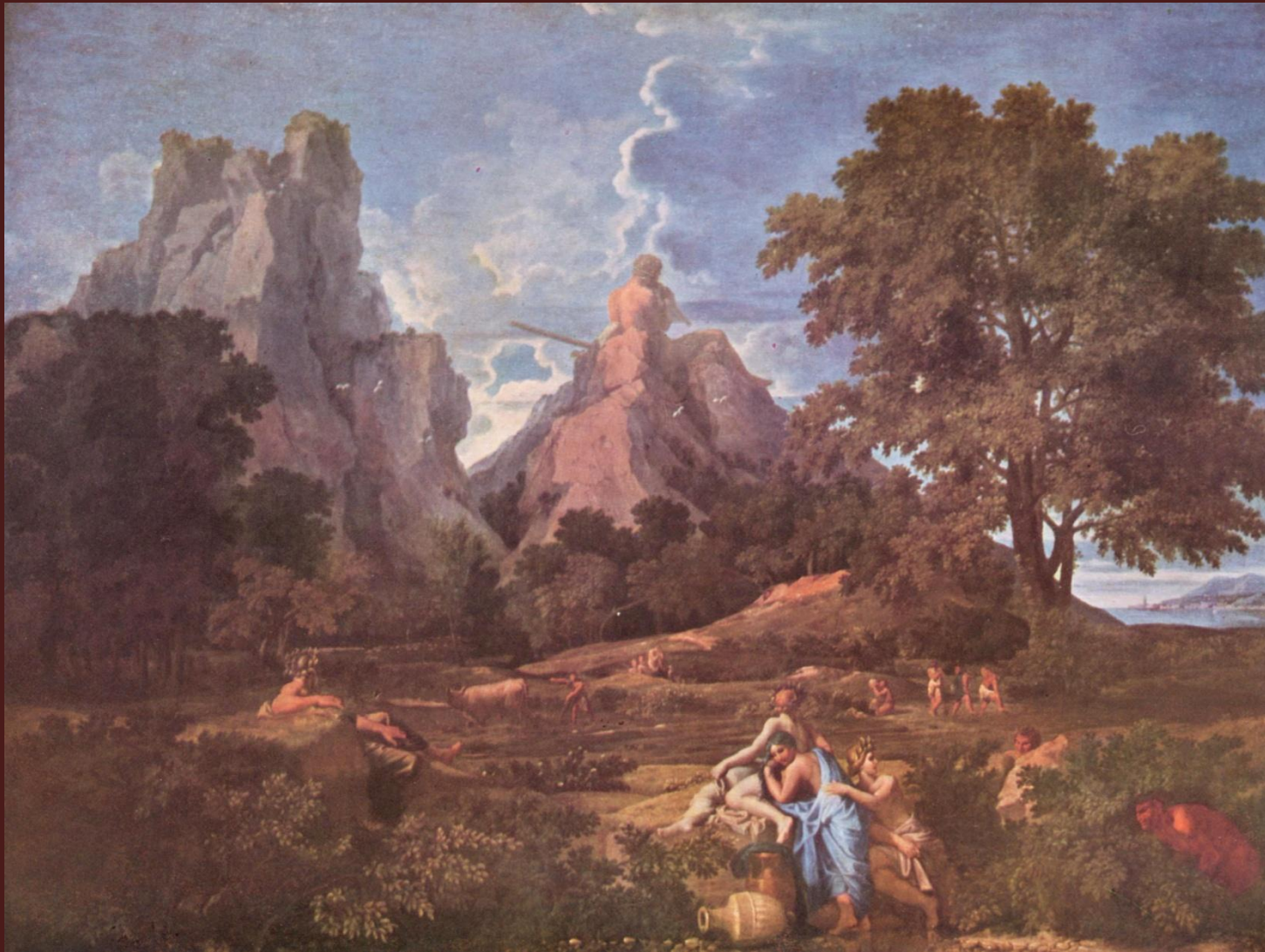
Никола Пуссен. «Пейзаж с Полифемом», 1649