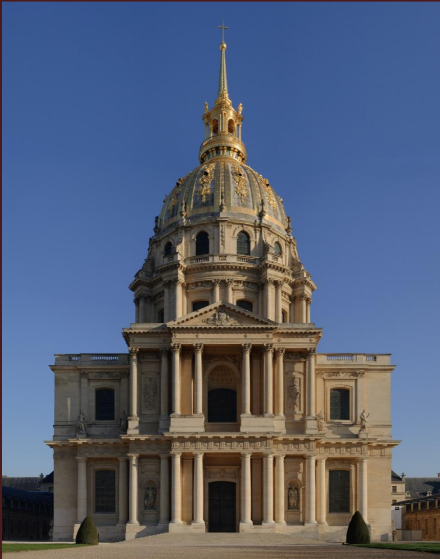
Собор дома Инвалидов в Париже