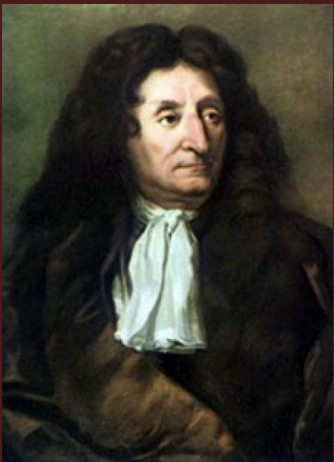
Жан Де Лафонтен