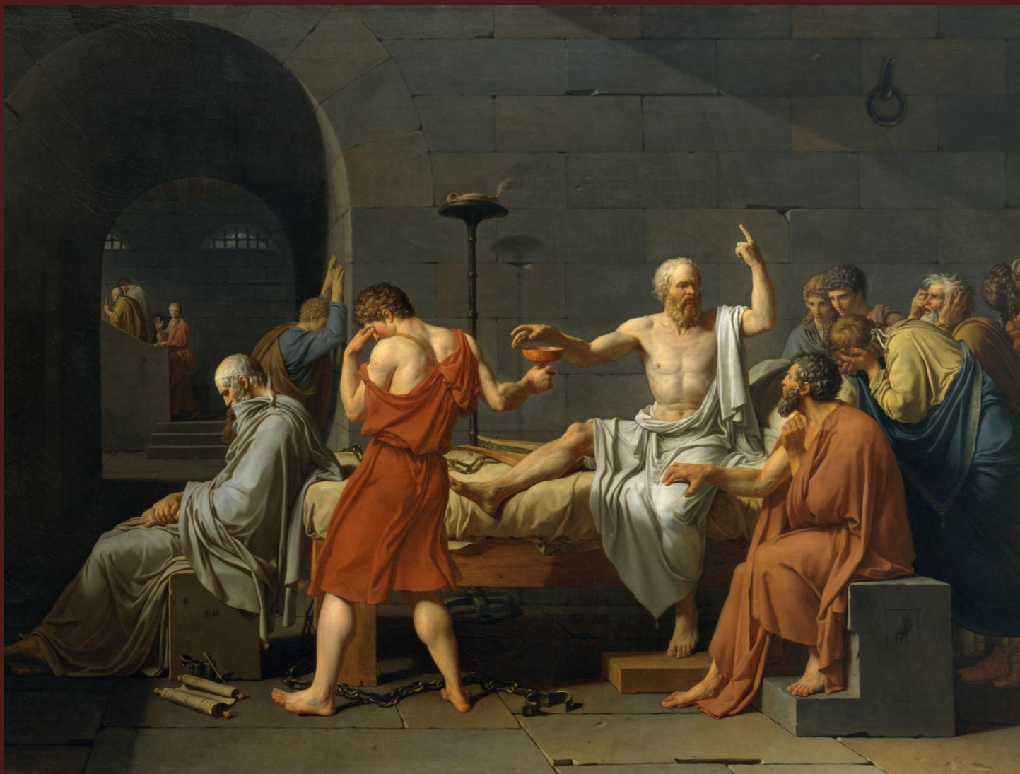
Жак-Луи Давид. «Смерть Сократа», 1787