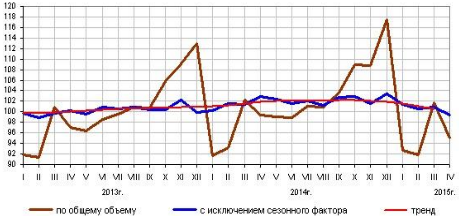
Индексы промышленного производства в % среднемесечном значению 2013-2015г.