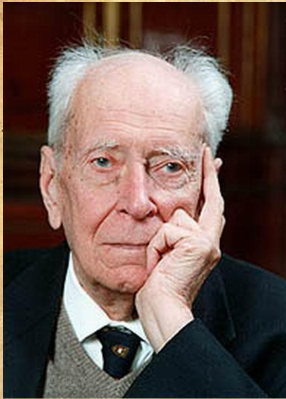
Дмитрий Сергеевич Лихачёв (1906 – 1999)

“Древнерусская литература наполняет нас гордостью за наших далёких предков предшественников, учит нас с уважением относиться к их труду, борьбе, к заботам о благе родины”.