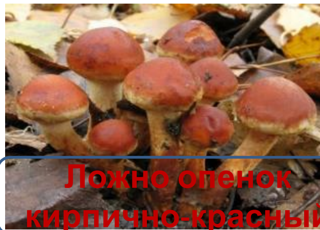
Ложно опенок кирпично-красный