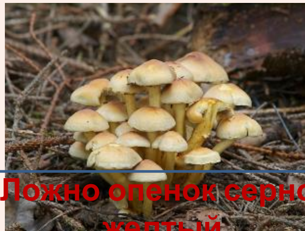
Ложно опенок серно-желтый