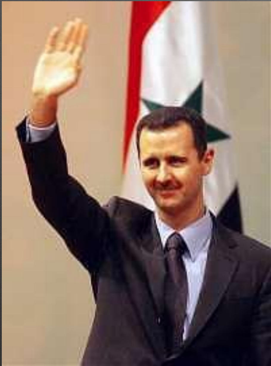
Президент Сирии Башар аль Асад

По форме правления Сирия - суперпрезидентская республика. Глава государства - президент, избираемый сроком на 7 лет.