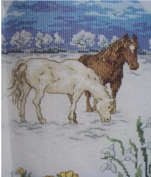
«Соседи по планете» (вышивка крестом)