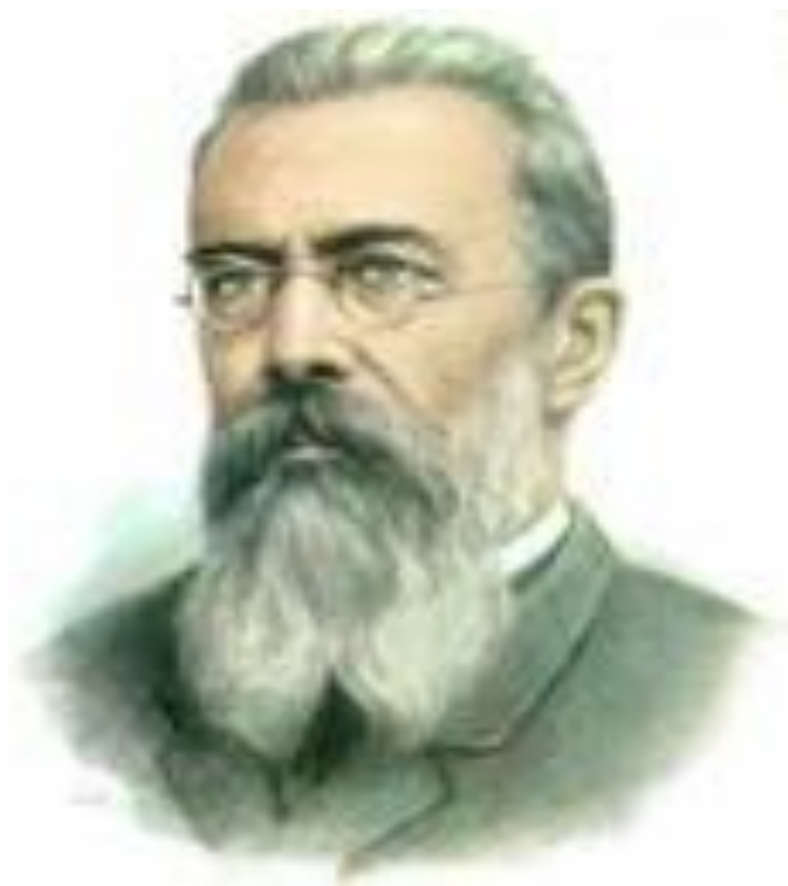
Н.А.Римский - Корсаков