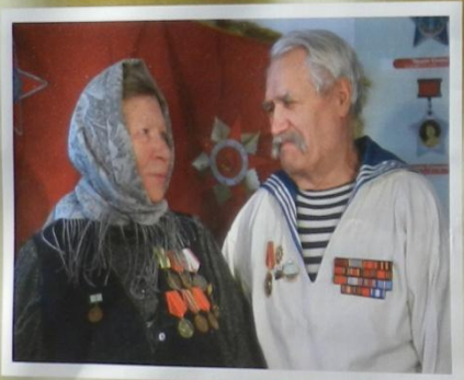
Какой бы мы красивой были парой