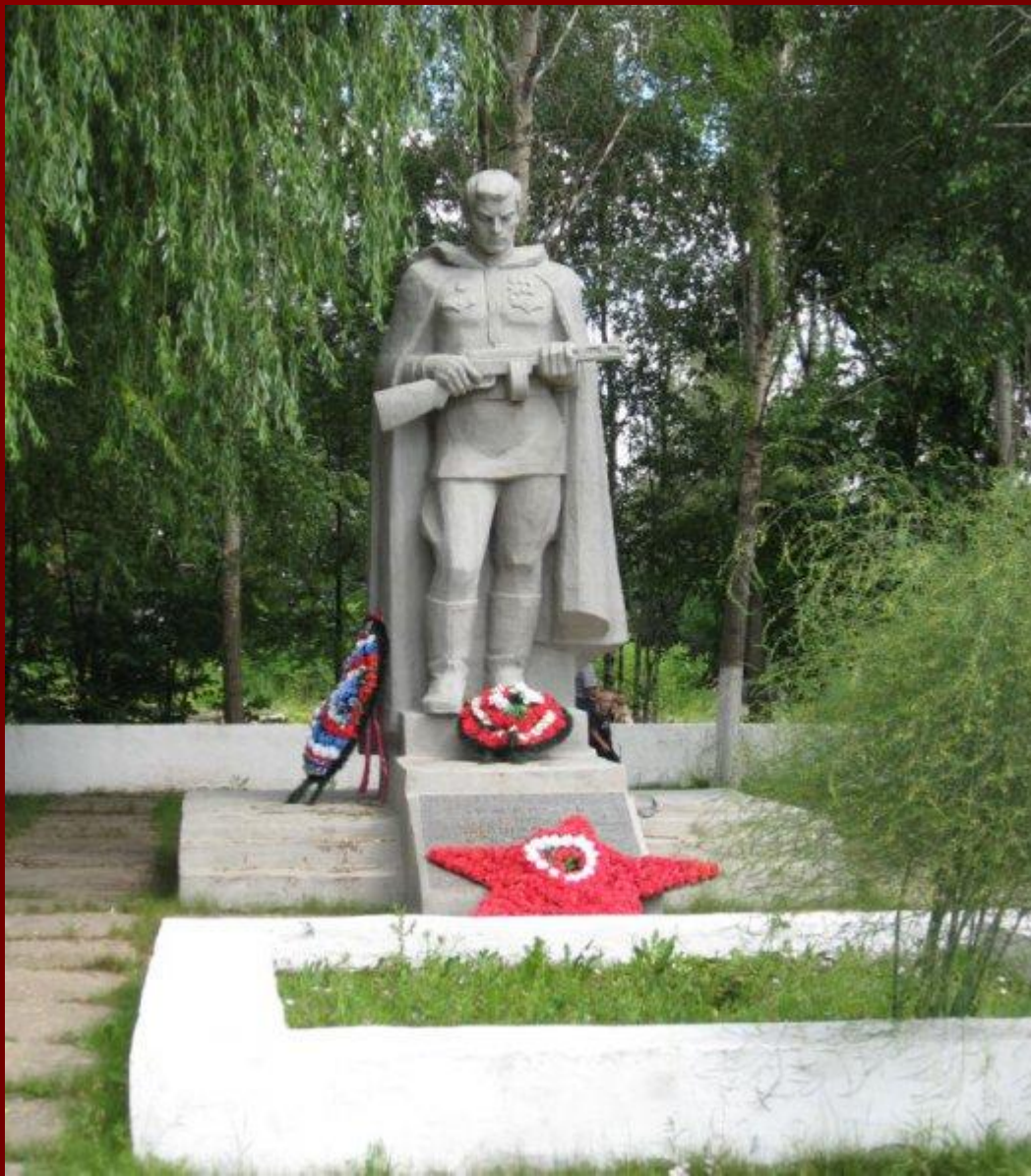
Памятник неизвестному солдату на кургане славы города Алексина Тульской области