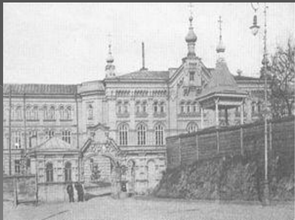
Київська духовна академія