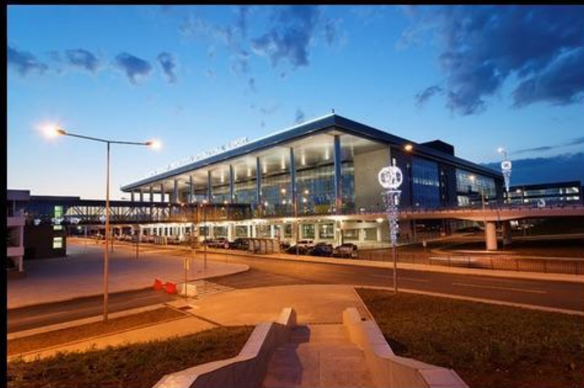
Донецкий аэропорт Порошенко: