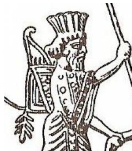
Сын Кира Камбис II продолжил завоевания и в 522 году до н.э. захватил Египет с барельефа.

Ни одному полководцу прежде не удавалось одержать так много замечательных побед. Ни один царь до него не владел столь обширным государством, как Кир Великий. Его держава простиралась от границ Индии на востоке до Средиземного моря на западе.