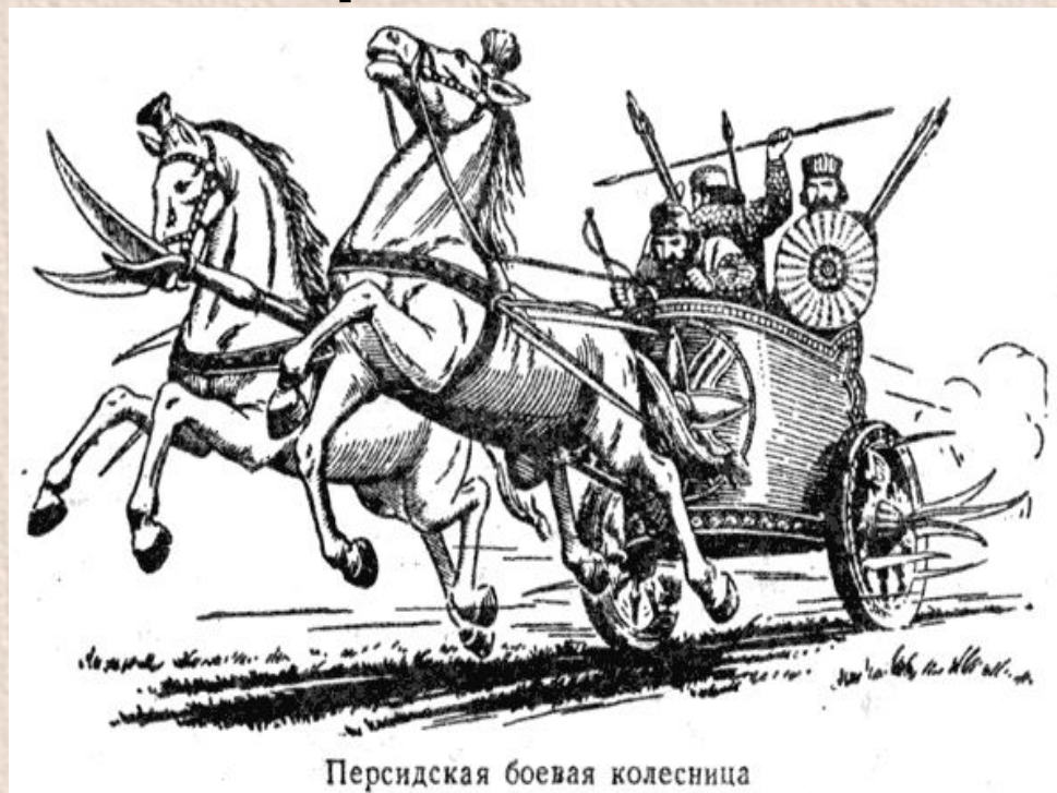
Персидская боевая колесница