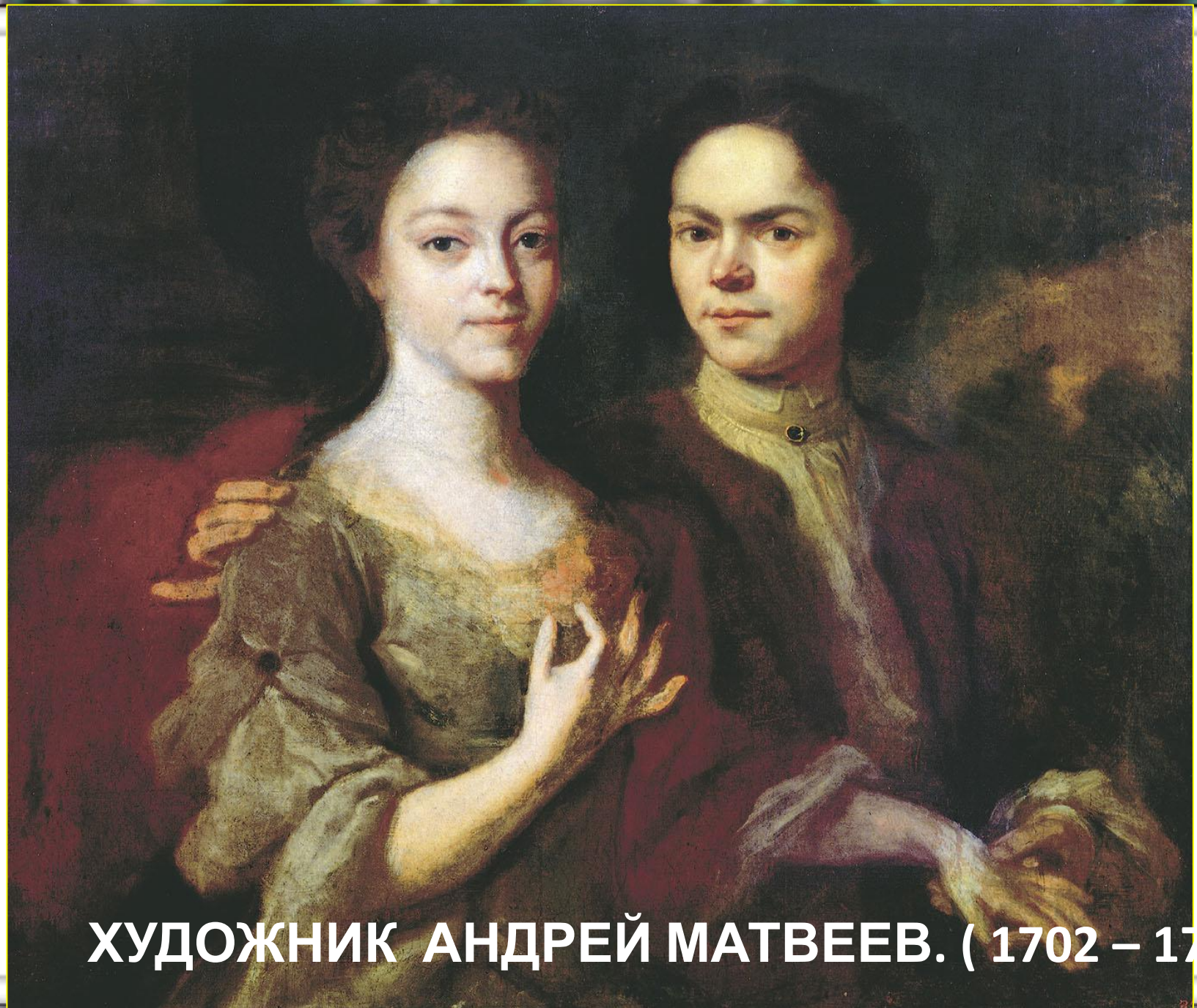
ХУДОЖНИК АНДРЕЙ МАТВЕЕВ. ( 1702 – 1779 ).