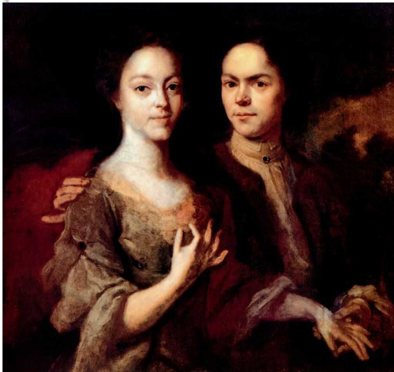
Портрет с женой

Небывалым расцветом новых ремесел и искусств начавшимся в XVIII веке русская культура обязана в первую очередь Петру посылавшему талантливую молодежь учиться в Европу. Один из первых кого царь послал обучаться за границу мастерству живописца стал Андрей Матвеев. По существующей легенде юный Андрей повстречал царя в Софийском соборе Новгорода и тот предложил ему ехать учиться.