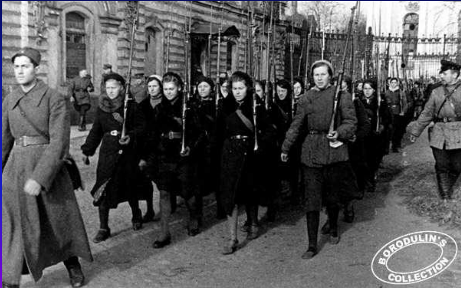
Женский стрелковый батальон.

На защиту города поднялись все его жители: 500 тысяч ленинградцев строили оборонительные сооружения, 300 тысяч ушли добровольцам в народное ополчение, на фронт и в партизанские отряды.