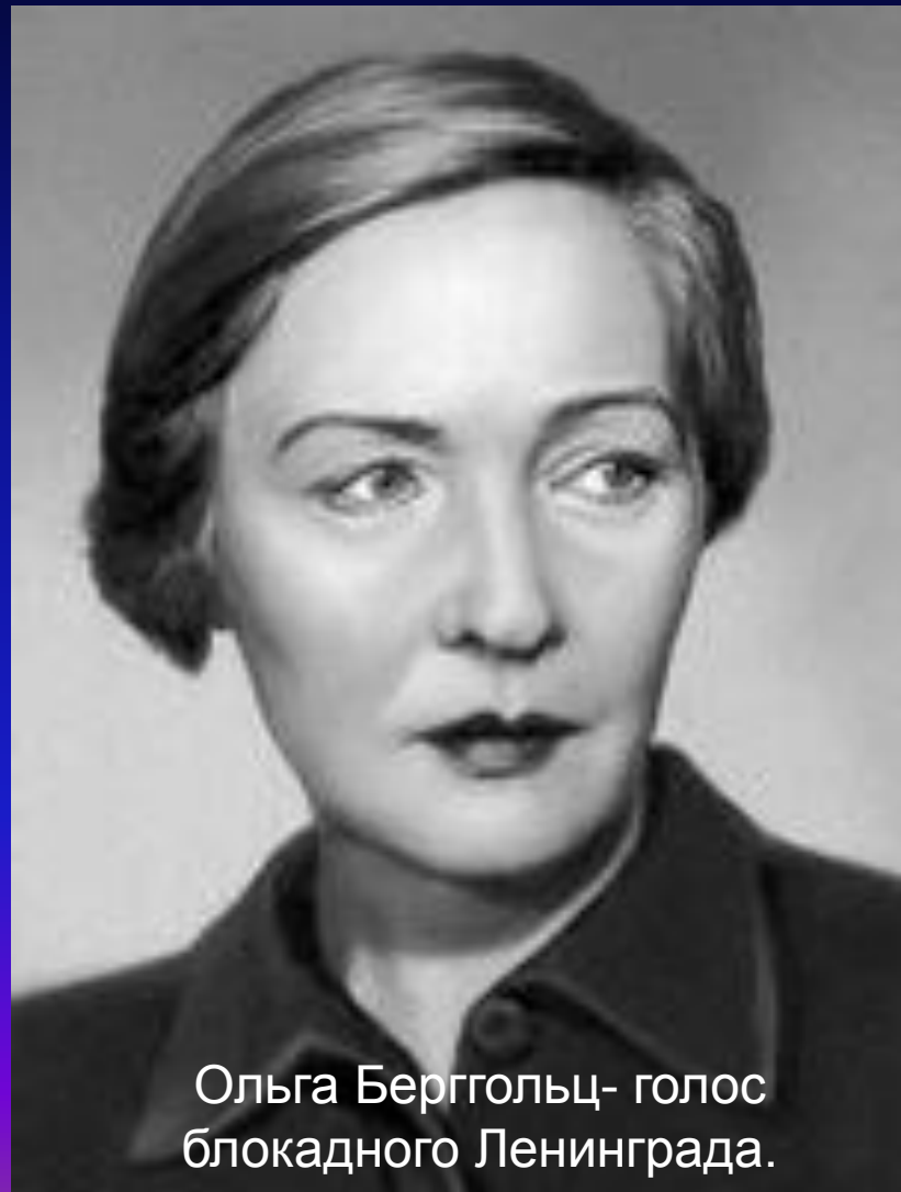
Ольга Берггольц- голос блокадного Ленинграда.