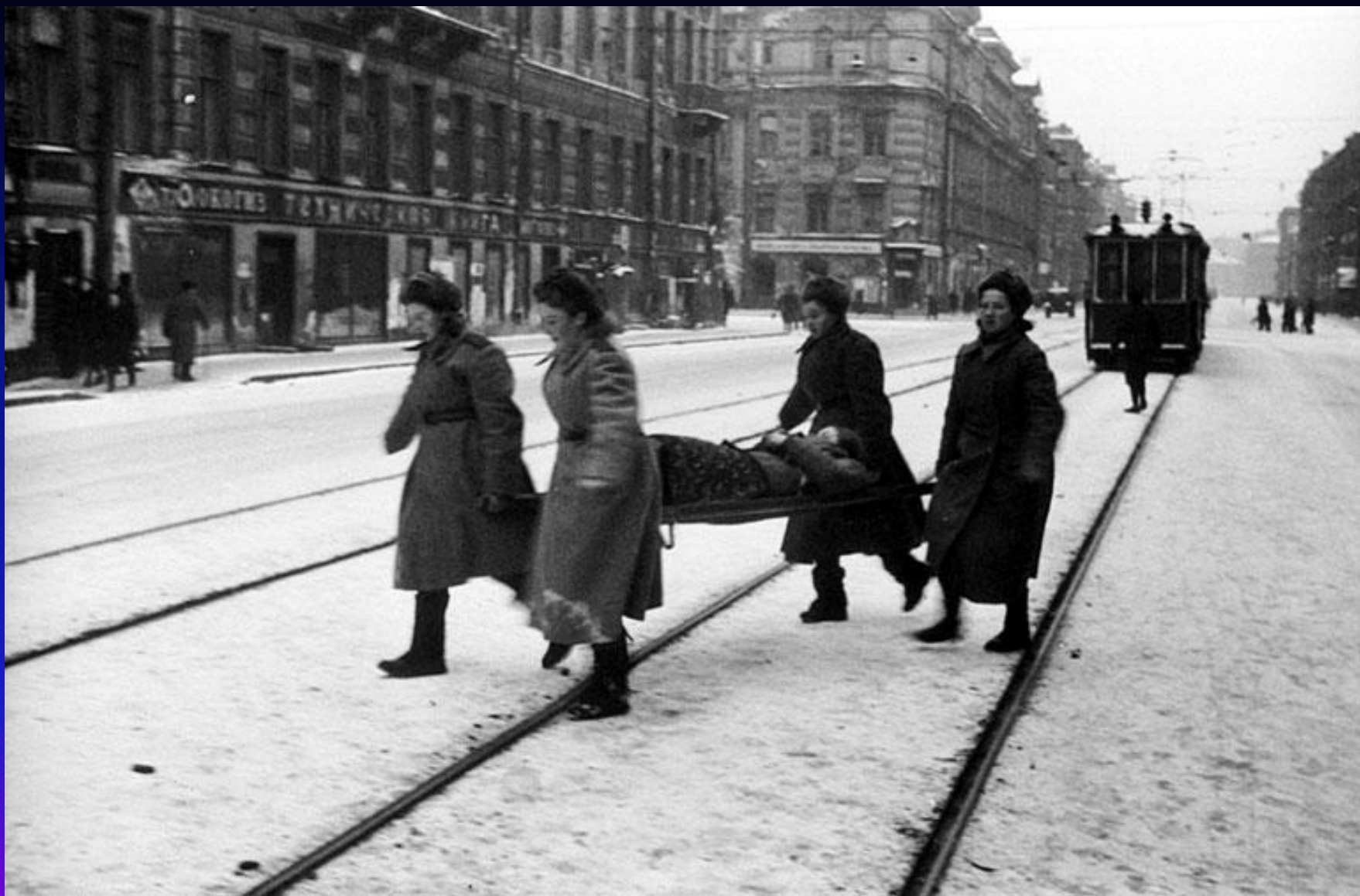
Декабрь 1943 г. Место съемки: г. Ленинград