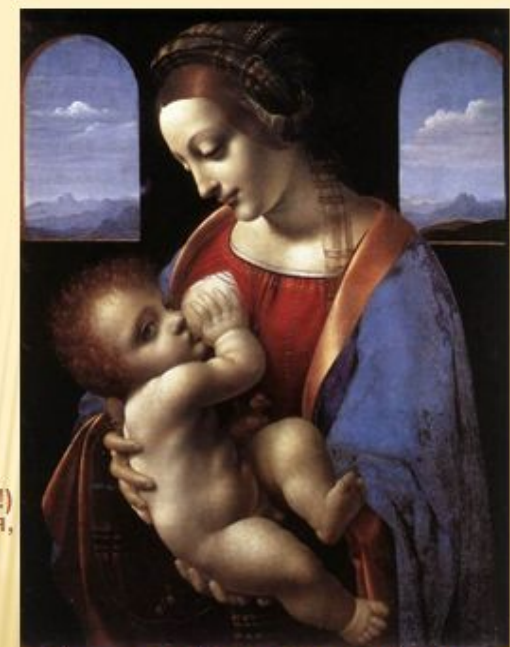
Леонардо да Винчи. Мадонна Литта

Есть в природе знак святой и вещий, Ярко обозначенный в веках! Самая прекрасная из женщин Женщина с ребёнком на руках.