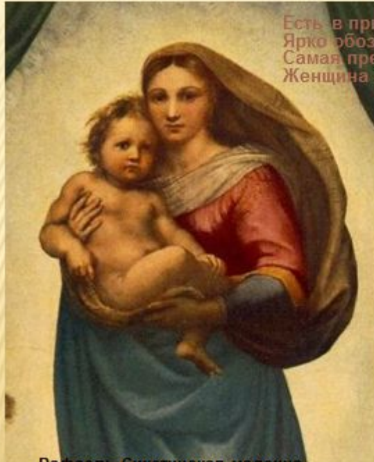
Рафаэль. Сикстинская мадонна

Слово «мадонна» встречается в названии картин многих художников прошлого: Боттичелли, Рафаэля, Леонардо да Винчи и др. На этих картинах изображалась чаще всего женщина с младенцем, женщина-мать.