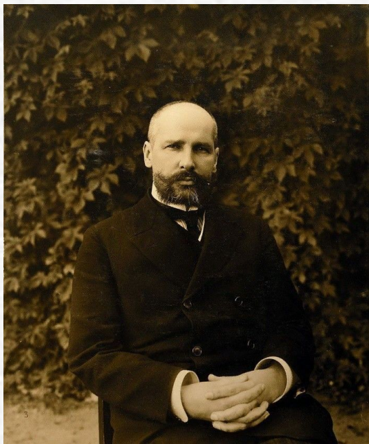
П. А. Столыпин