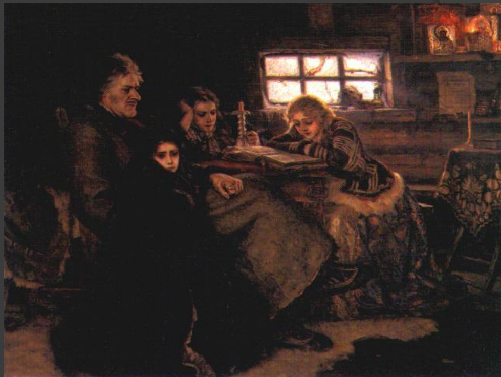
Суриков В.И. Меншиков в Березове.