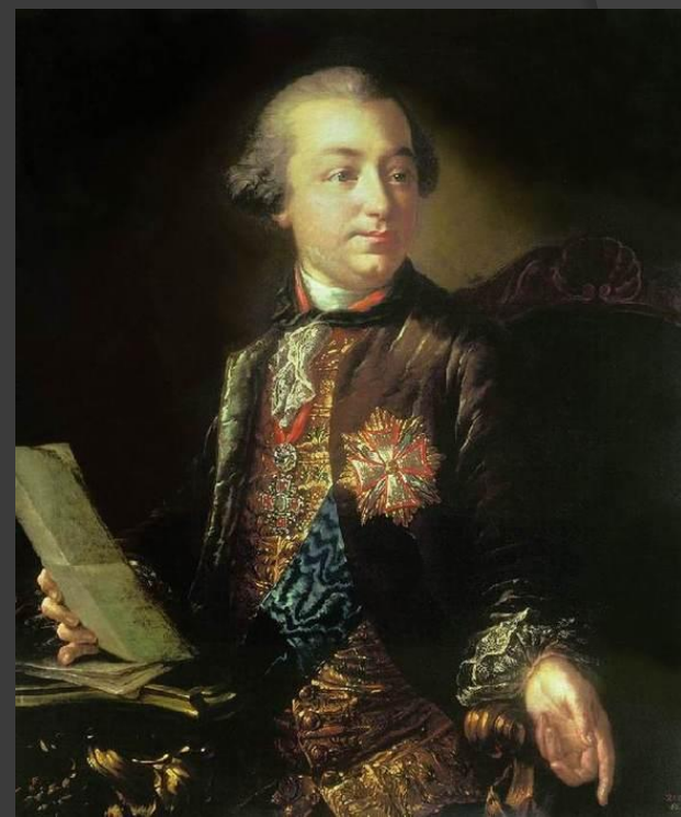
Иван Иванович Шувалов.