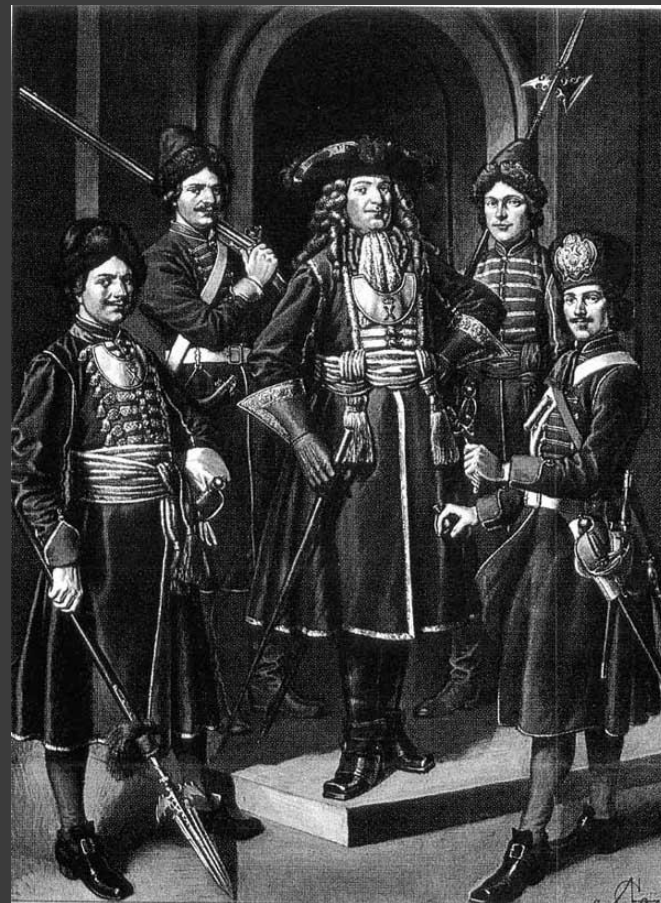
Летин "Служилое платье от Петра Великого. Гвардейские мундиры»