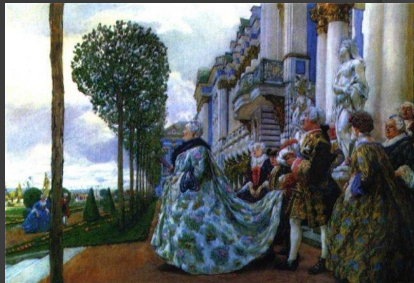
Императрица Елизавета Петровна в Царском Селе Е. Е. Лансере