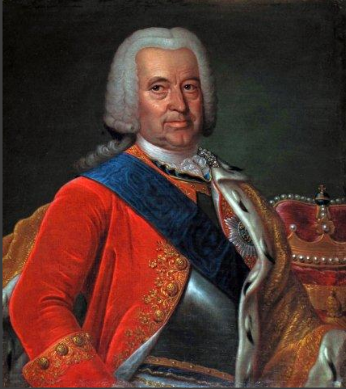
Эрнст Иоганн Бирон