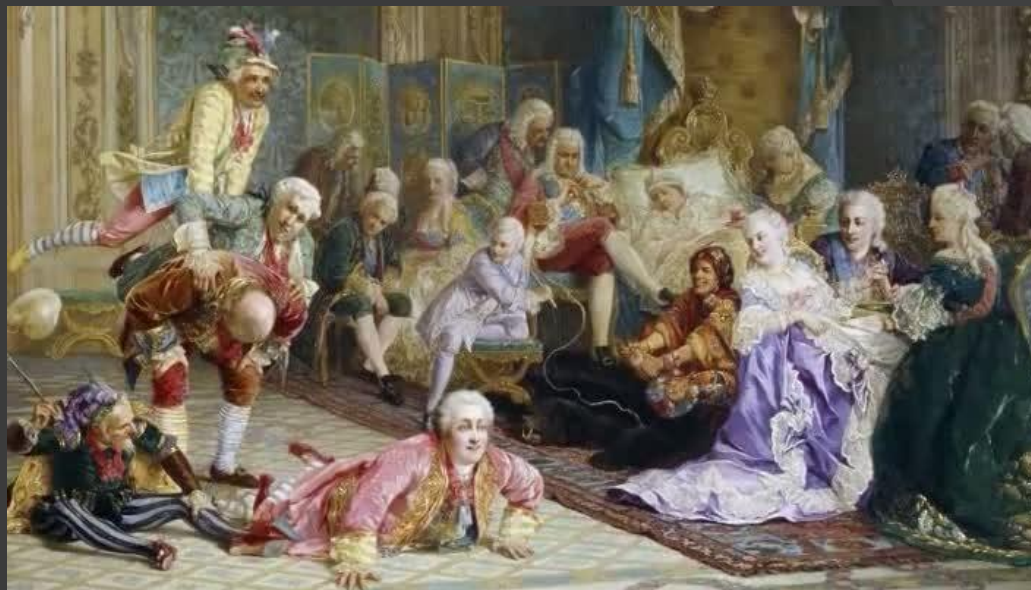
Шуты при дворе императрицы Анны Иоанновны.