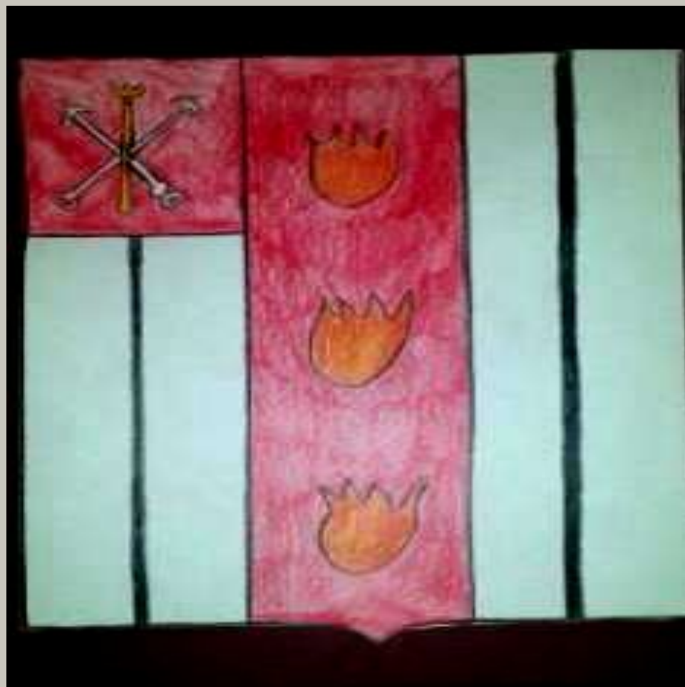
«Герб города Колпино», Коленько Иван

Император Александр III утвердил проект герба посада Колпино 23 сентября 1881 года.