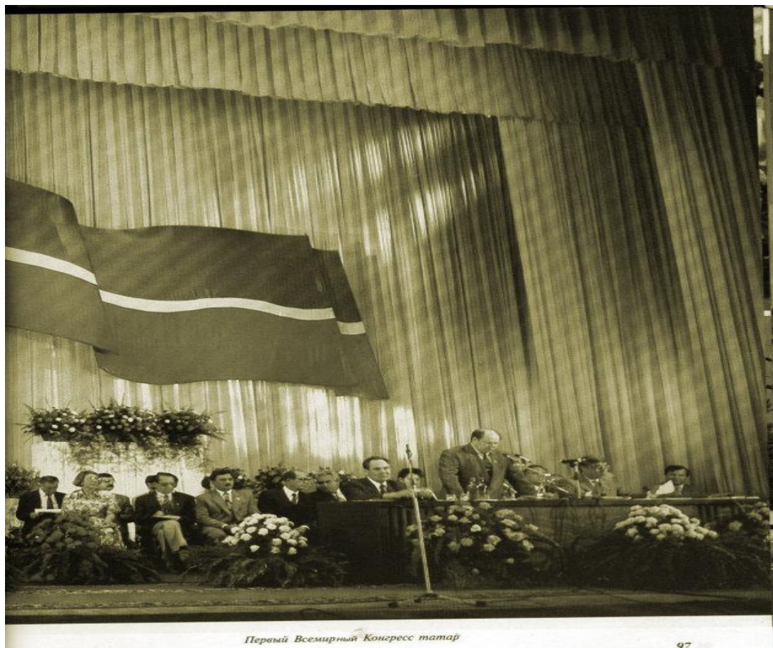
Первый Всемирный Конгресс татар