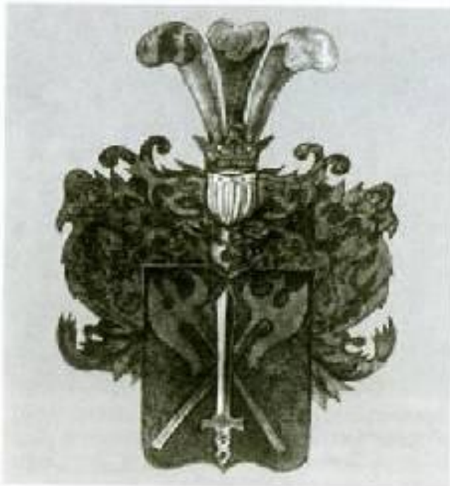
Герб рода Некрасовых.