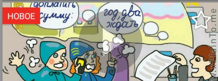
Застать на месте представителя