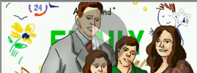
Карта Standart Family