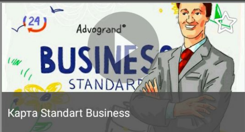
Карта Standart Business