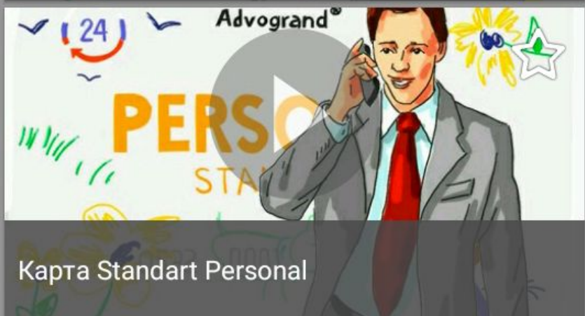
Карта Standart Personal