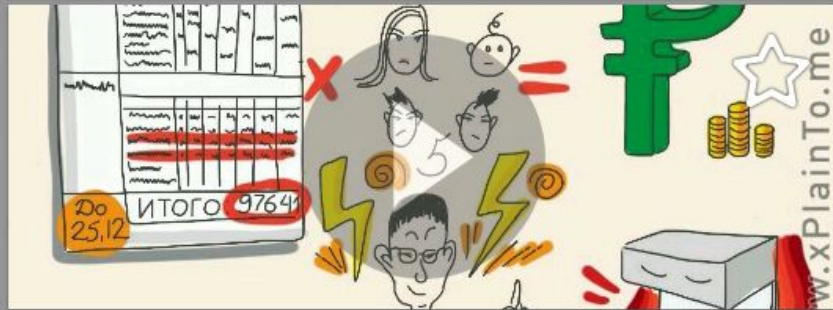
Свет и вода