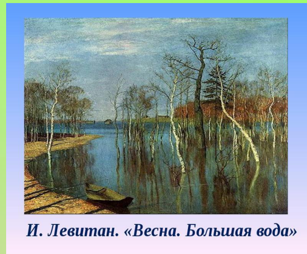
И. Левитан. «Весна. Большая вода»