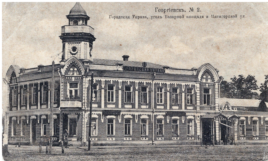
Георгиевскъ. № 2. Городская Управа, уголь Базарной площади и Пятигорской ул.

Конец 18 века - это период образования города Георгиевск. А начало 19 века - это время расцвета этого города. В этом городе постоянно проходили крупнейшие ярмарки. Начиная с 19 века Георгиевск превратился в центр производства шелка. В последующем здесь открывались различные углища, появилась легендарная управа.