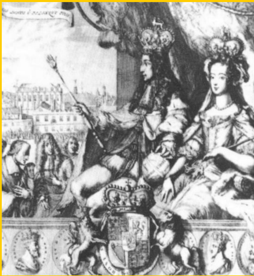
Яков II. Гравюра к.17 в.

В 1685 г. королем стал Яков II. Он распустил парламент и стал открыто покровительствовать католикам. В 1688 г. парламент пригласил в страну дочь короля Марию и ее мужа – Вильгельма Оранского. Яков II бежал во Францию. Эти события, названные «славной революцией» положили конец между парламентом и королями.