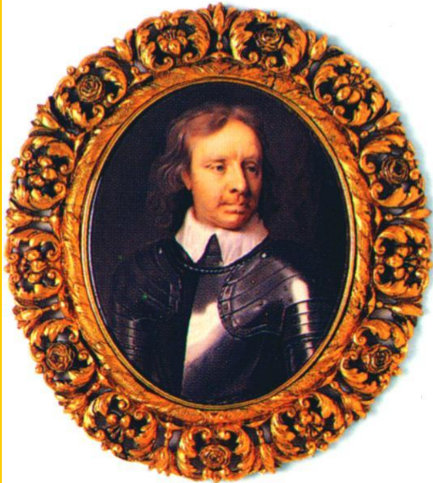
Оливер Кромвель. Медальон 17 в.

В стране было неспокойно. Выражали недовольство крестьяне, не получившие земли. Долгий парламент потерял своё влияние. Кромвель видел, что может взять власть в свои руки. Его поддерживали богатые собственники, заинтересованные в установлении сильной власти.