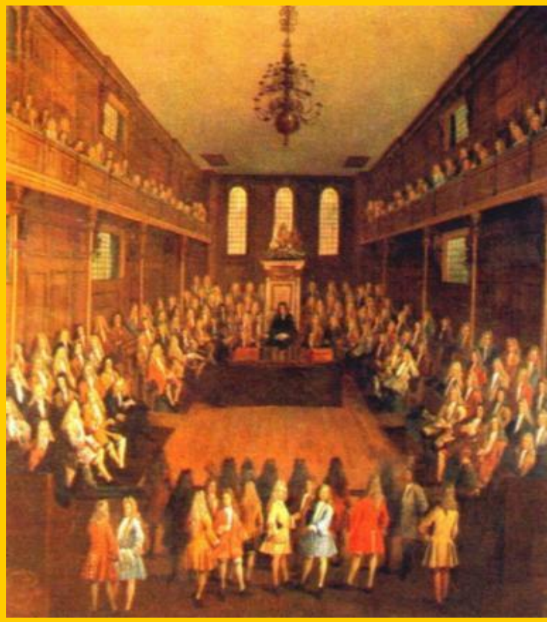
Английский парламент. Цветная гравюра н.18 в.

Страна стала называться Великобританией. С 1714г. в стране правила Ганноверская династия. Король назначал премьер-министра из партии, победившей на выборах. Кабинет Министров отчитывался перед парламентом. Т.о. в Англии произошло разделение властей.