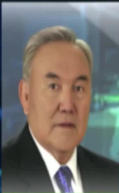
НҰРСҰЛТАН НАЗАРБАЕВ ҚАЗАҚСТАН РЕСПУБЛИКАСЫНЫҢ ПРЕЗИДЕНТІ