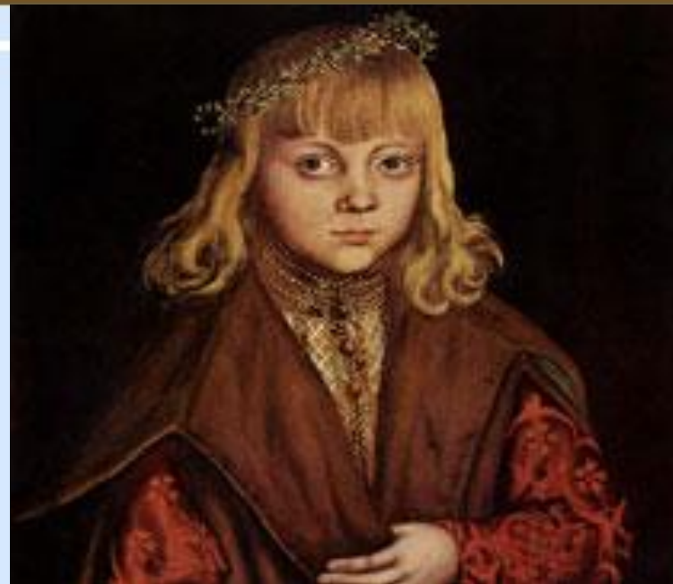
Принц Саксонии, 1517 Кранах Лукас