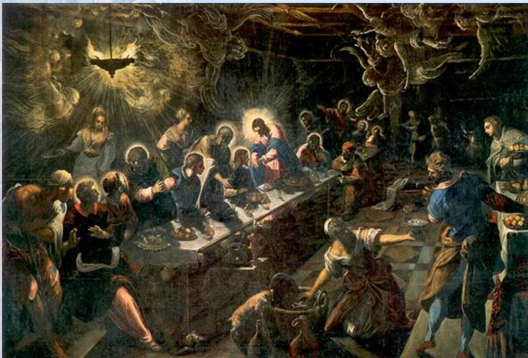
Венецианец Тинторетто в 1594 г. изобразил тайную вечерю как подпольную сходку в тревожных сумеречных отсветах