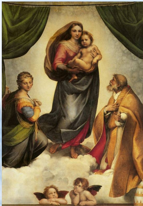
Рафаэль Санти “Сикстинская мадонна”