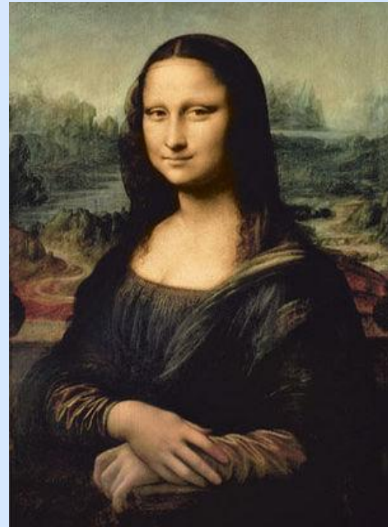
Леонардо да Винчи «Мона Лиза»