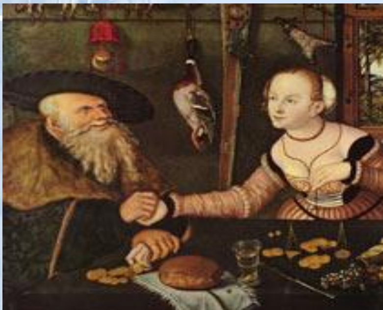
Мезальянс 1532 Кранах Лукас