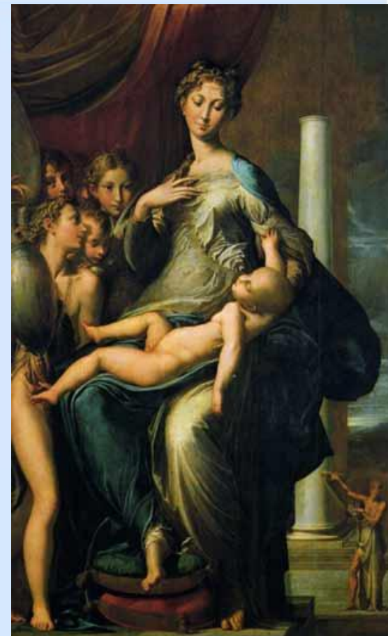
Мадонна с длинной шеей. Пармиджанино