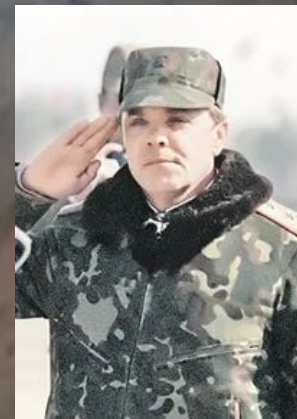
Борис Всеволодович Громов

Закончилась необъявленная война. Больше не будет боев и «зеленок», «черных тюльпанов», юных вдов, не будет инвалидных колясок, не будет слез отчаяния при расставании и слез радости при встречи. Многого уже не будет. Но забыть - невозможно! Надо помнить!