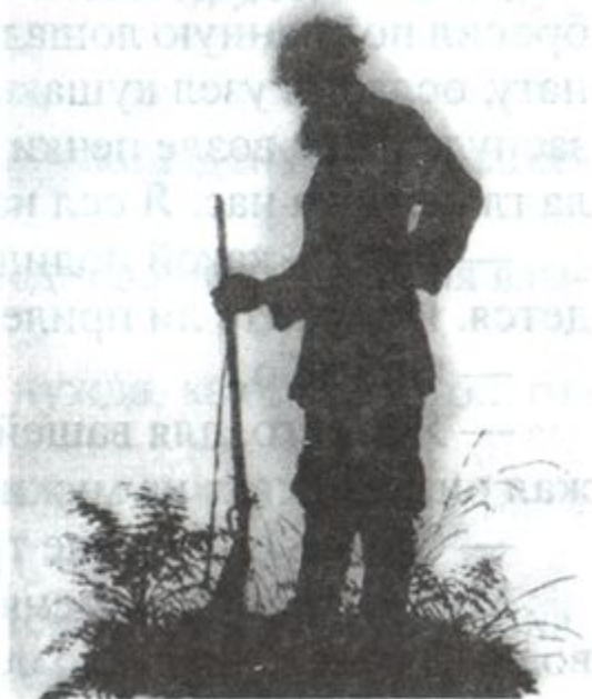
Е.М. Бем. Бирюк