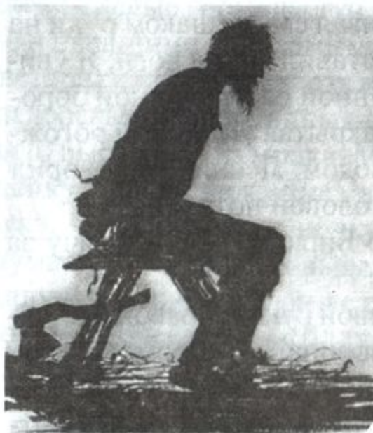
Е.М. Бем. Порубщик