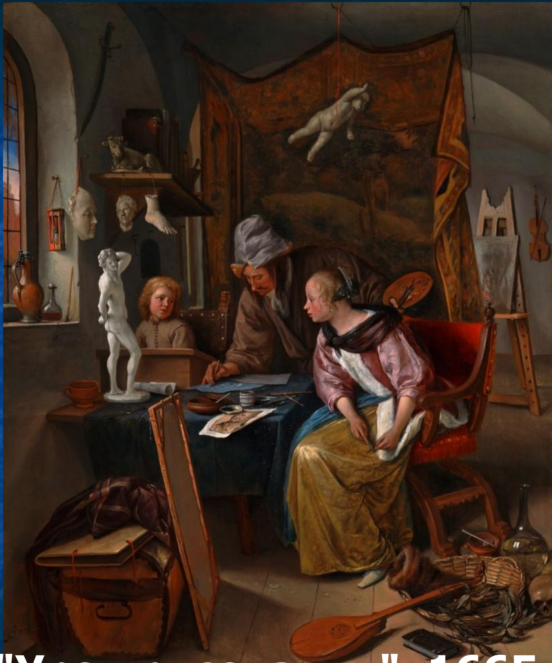
Стен Ян "Урок рисования", 1665 г.,