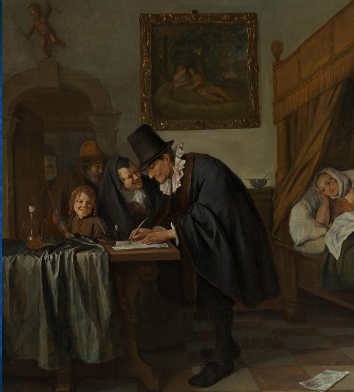
Стен Ян "Визит доктора",