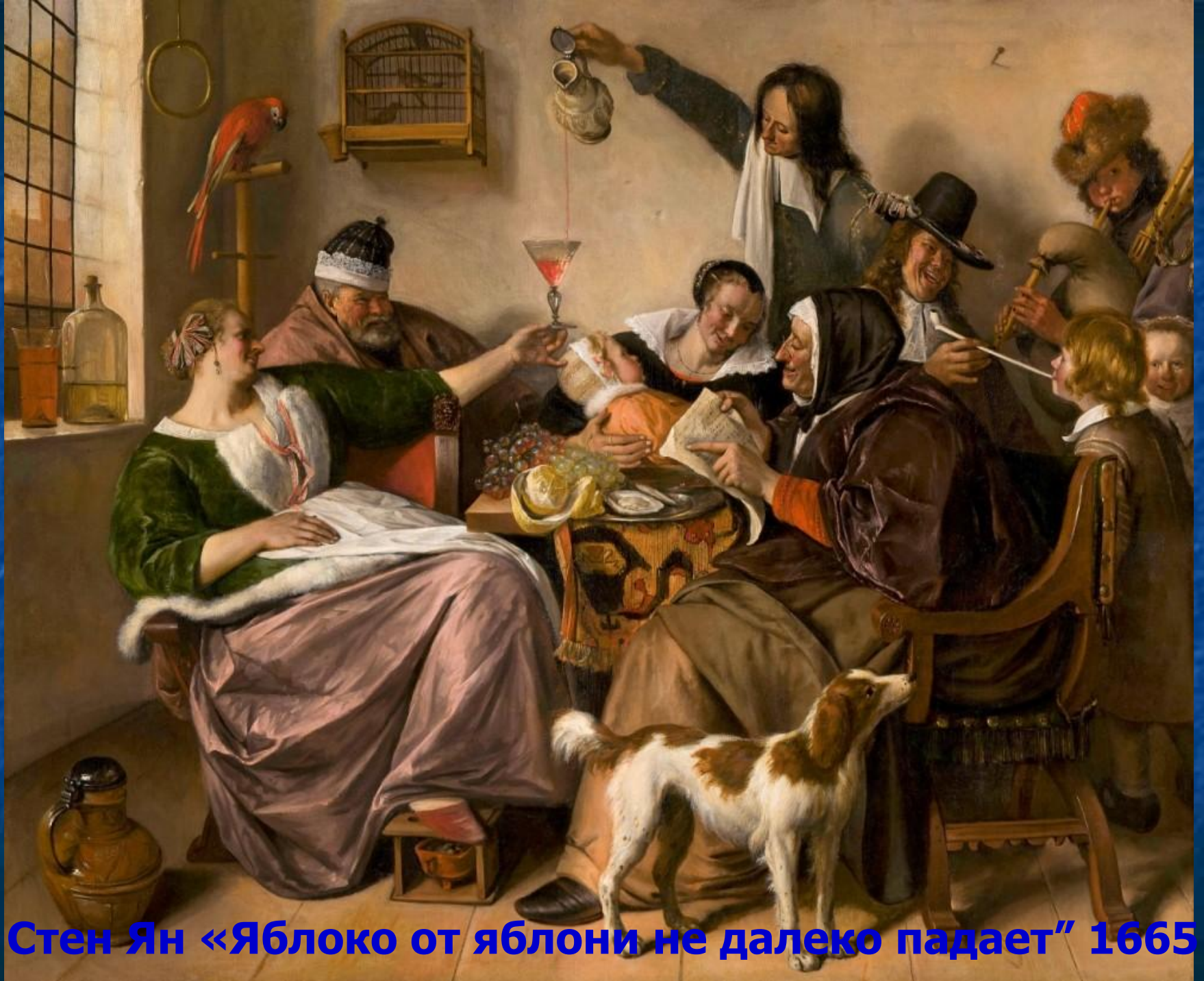
Стен Ян «Яблоко от яблони не далеко падает» 1665 г.,