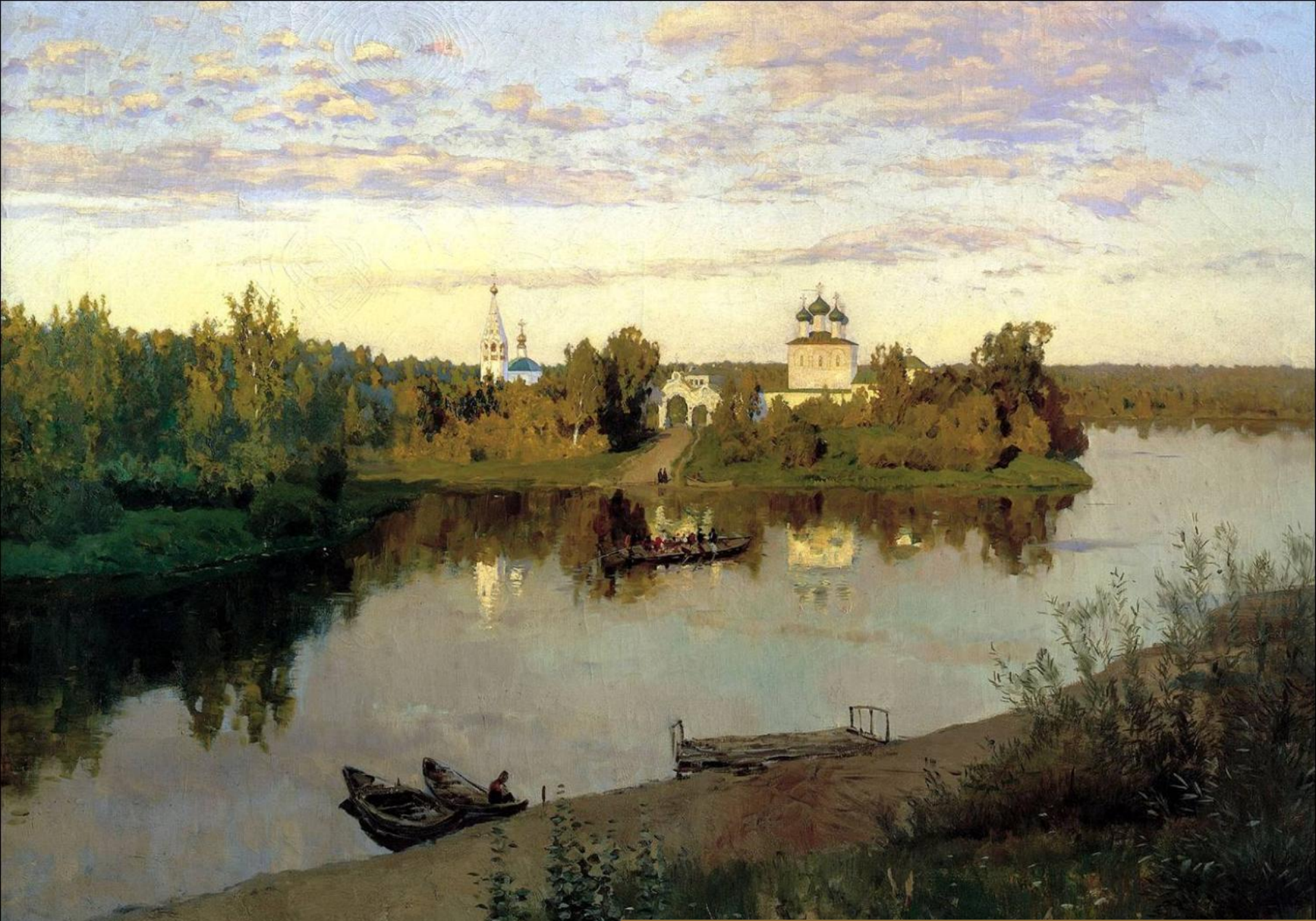
«Вечерний звон» И.Левитан