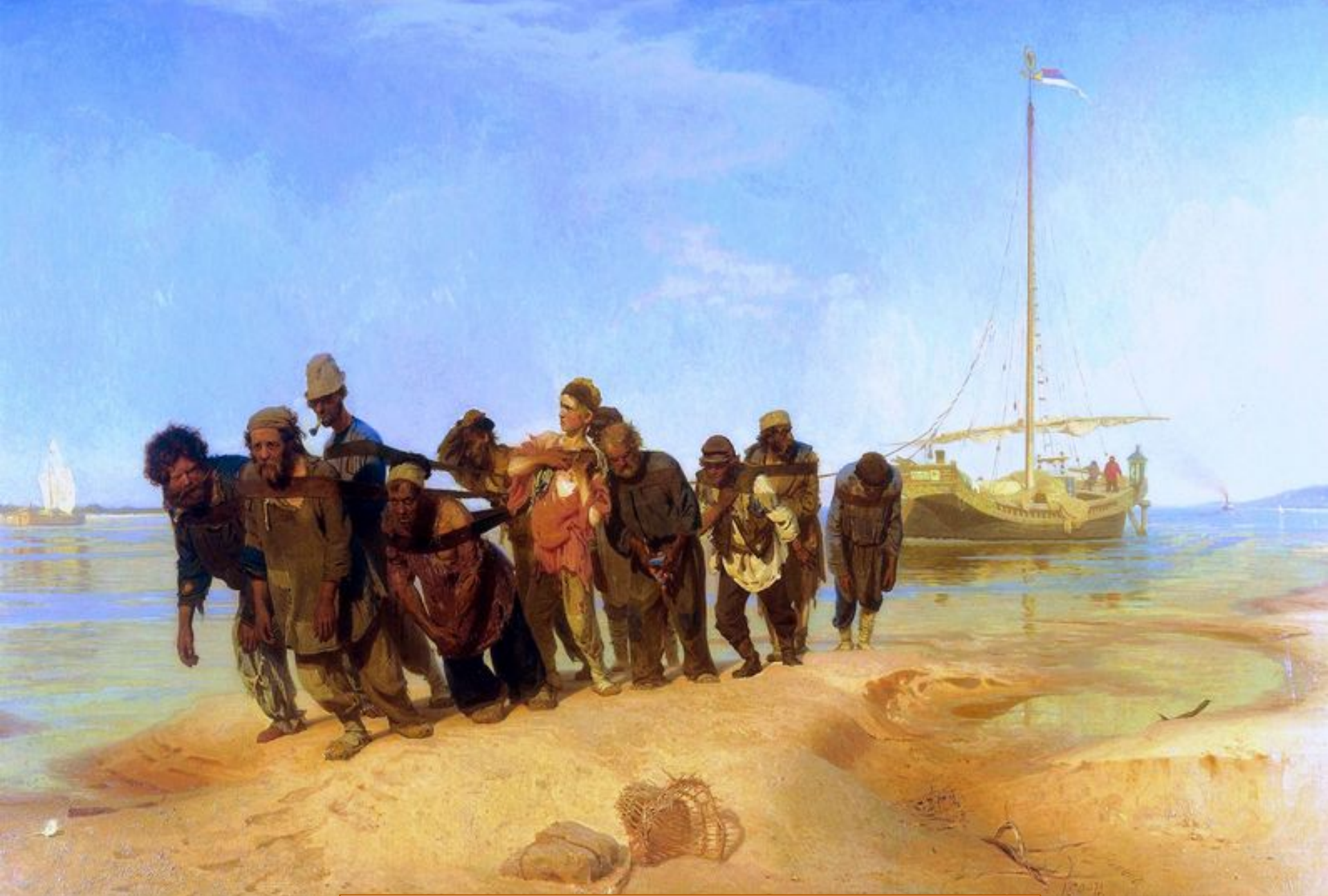
«Бурлаки на Волге» И.Репин