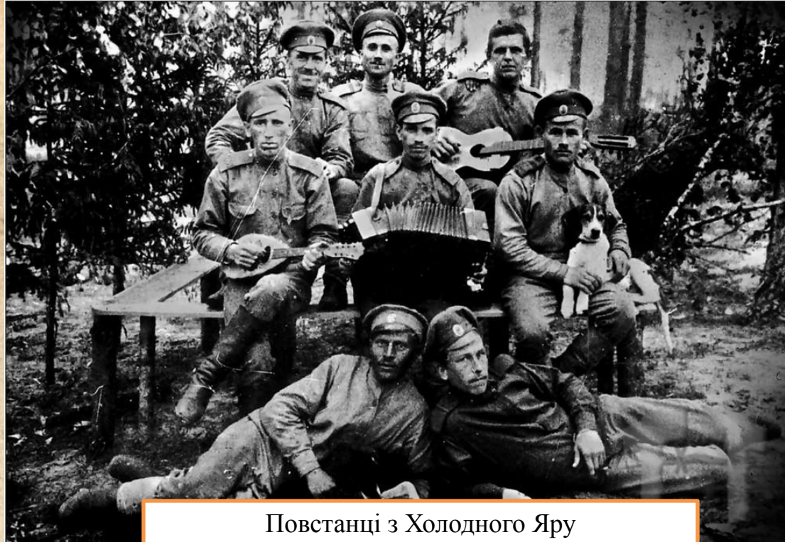
Повстанці з Холодного Яру

Після загибелі Василя Чучупаки 12 квітня 1920 р., Холодноярську республіку очолив його заступник Іван Деркач, він керував збройними силами регіону «Холодний Яр» під час антирадянського повстання у весняно-осінній період 1920 року. 8 вересня 1920 року — на з'їзді повстанських отаманів у Чигирині Деркач обраний членом Окружного повстанського комітету.