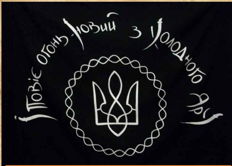
Прапор Холодноярської республіки