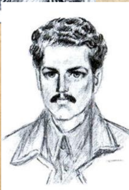
Кость Пестушко (Степовий-Блакитний)

У травні 1920 р. Кость Степовий-Блакитний створив та очолив Степову дивізію, яка налічувала від 12 до 18 тисяч бійців. Вів боротьбу з більшовицьким режимом партизанськими методами. Він був одним із керівників повстання весни-осені 1920 року. Діяв на Херсонщині, Катеринославщині, в Київській губернії, зокрема на Чигиринщині, в Холодному Яру, командував Першою Олександрійською повстанською армією. Після того, як дивізія об'єдналась із Холодноярськими збройними силами, Костя Блакитного 24 вересня 1920 року на конференції повстанців у містечку Медведівці обрано Головним отаманом Холодного Яру.