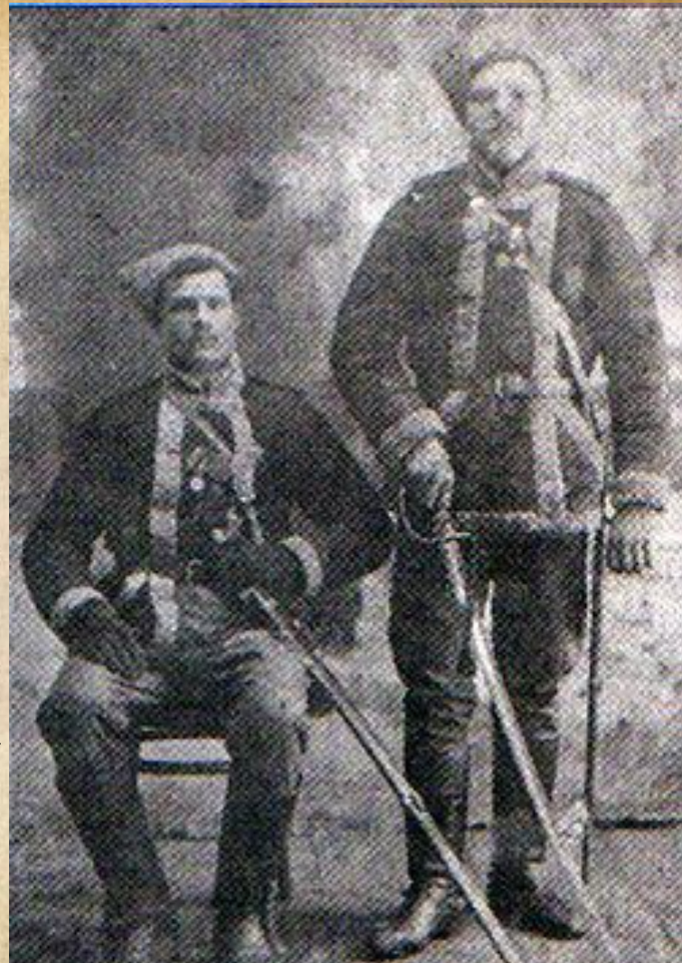
Козаки Холодного Яру з села Мельники з медалями Російської імперії на грудях.

У березні 1920 року Степова Дивізія армії УНР визволила Херсон від більшовиків та повела вдалий наступ на захід по лінії Кам'янка-Єградівка-Ружичів-Чигирин. Зупинилась дивізія в урочищі Холодний Яр, де з'єдналась з Холодноярськими збройними силами.