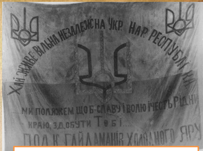
Прапор полку гайдамаків Холодного Яру

В жовтні 1920 року Кость Блакитний склав із себе повноваження Головного отамана Холодного Яру, у зв'язку з тим що більшовики почали палити його рідні села, і розстрілювати родини повстанців в Катеринославській губернії, вирушивши на чолі Степової дивізії. Але наближення холодів виявило ще одну проблему для повстанців: козаки Степової дивізії не мали зимової амуніції. Це змусило Костя Блакитного піти на часткову демобілізацію дивізії. Дехто з її особового складу повернувся до Холодного Яру, вирішивши продовжувати боротьбу, серед таких був кінний полк отамана Іванова. Більшість демобілізованих бійців перейшли до підпільної діяльності.