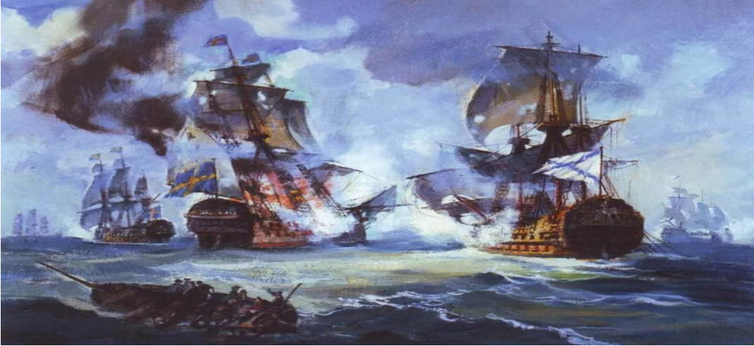
Завершение Северной войны