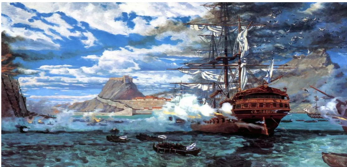
ВЗЯТИЕ КРЕПОСТИ КОРФУ