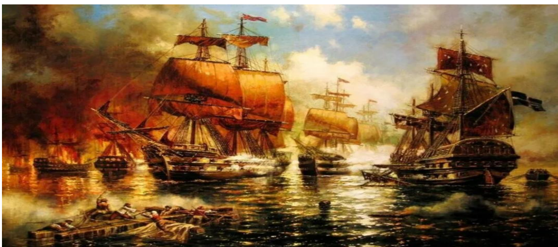
Сражение у мыса Тендра