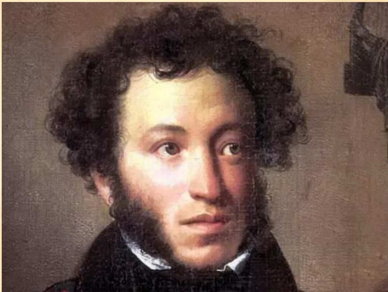
Александр Сергеевич Пушкин (1799 - 1837)